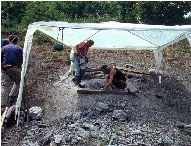
Zur Bergung aus dem harten Umgebungsgestein war schweres Gerät nötig.

Für Aufsehen sorgte in Fachkreisen auch, dass der Schädel in einer Art «Kamikaze-Stellung» im Gestein eingebettet war. Auf den Meeresgrund absinkende tote Tiere kommen dort meist flach zu liegen und werden deshalb während des Versteinungsprozesses parallel zu den Gesteinsschichten eingebettet. Dies war beim Ichthyosaurier vom Hauenstein nicht der Fall. Er steckte senkrecht mit dem Kopf voran im Meeresboden. Diese Stellung kann damit erklärt werden, dass der Körperschwerpunkt bei dieser Ichthyosaurier-Art weit vorne lag und das Tier somit nach dem Tode kopfvoran zu Boden sank.