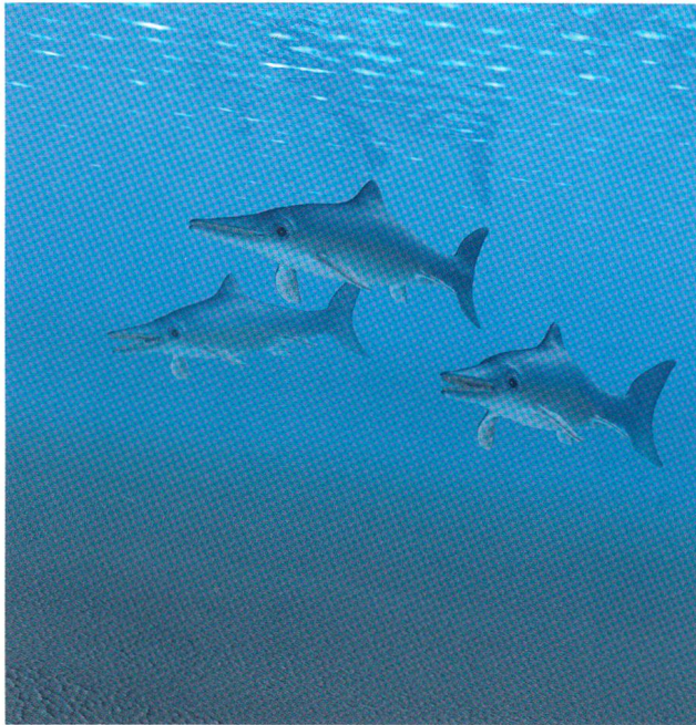
Computeranimationen vermitteln im Museum ein packendes Bild von der Lebensweise des Ichthyosauriers.