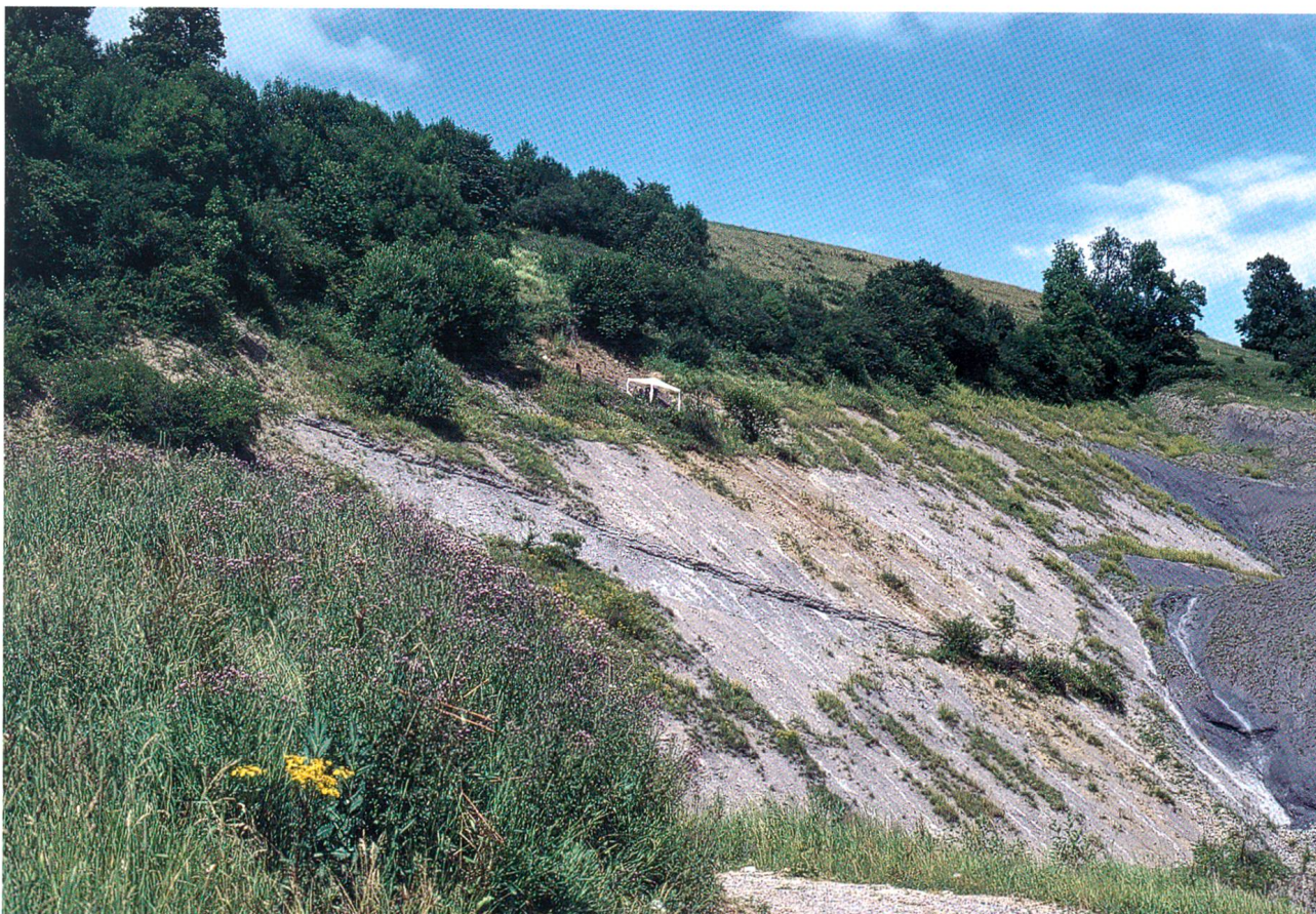
Fundstelle in der Tongrube auf dem Unteren Hauenstein mit dem Grabungszelt

Seit Mai des vergangenen Jahres zielt der versteinerte Schädel eines Ichthyosauriers die erdgeschichtliche Ausstellung des Naturmuseums Olten. Fischechsen oder Fischechsen, wie diese Tiere auch genannt werden, glichen in ihrer Gestalt Haien oder Delfinen. Verwandtschaftlich gehören sie aber ganz anderswohin, es sind Reptilien. Der auf dem Unteren Hauenstein gefundene Ichthyosaurier-Schädel stammt von einem etwa 1,9 Meter langen Jungtier, das vor 190 Mio. Jahren im Jurameer gelebt hat. Erwachsene Tiere dieser Ichthyosaurier-Art messen bis zu vier Meter.