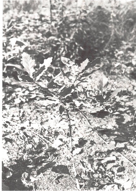
Eichensetzling im Sommerlaub

Am letzten Apriltag setzte eine erste Primarschule im östlichen Hardwald auf einem Kahlschlag unter Anleitung des Försters um die 800 junge Bäumchen: etwa 400 Hagenbuchsetzlinge und ebenso