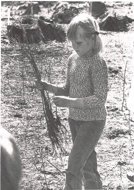
Nachschub der Setzlinge

Jedes Beginnen ist die Folge einer Idee. Die Natur hat mich von jeher gefesselt. Das hängt wohl damit zusammen, dass ich in einem Bauerndorf aufgewachsen bin und schon von frühester Kindheit an mit der Natur verbunden war: mit Blumen, Tieren, dem Wasser und dem Wald. Später war es für mich selbstverständlich, dass ich auch meine Schüler auf die Schönheiten in der Natur und ihr oft rätselvolles Wirken aufmerksam zu machen versuchte. Hand in Hand mit der Liebe zur Umwelt geht auch ihre Pflege. Weil die Veränderung, Verschandelung und Zerstörung der Natur stets sichtbarer fortschritt, suchte ich nach einem Weg, um bereits Schüler, also den jungen Menschen, mit dem Schutz der stark gefährdeten Natur vertraut zu machen. Theoretisch war die Schule allgemein schon längst am Werk, um diese schöne