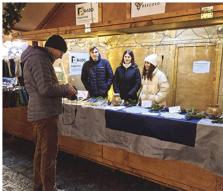
Erste Verkaufserfahrung im Oltner Adventsdorf, Dezember 2022

23 anderen Teams aus der ganzen Schweiz, auszustellen. Verkaufsgespräche, Interviews und sogar eine Bühnenpräsentation standen auf dem Programm. Diese Erfahrung war zweifellos lehrreich und trug dazu bei, unsere Fähigkeiten als angehende Unternehmer und Unternehmerinnen weiterzuentwickeln.