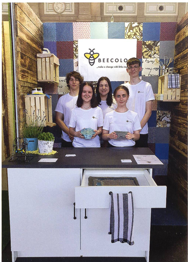
Verkaufsstand von BEECOLO im Shopville Zürich, April 2023

23 anderen Teams aus der ganzen Schweiz, auszustellen. Verkaufsgespräche, Interviews und sogar eine Bühnenpräsentation standen auf dem Programm. Diese Erfahrung war zweifellos lehrreich und trug dazu bei, unsere Fähigkeiten als angehende Unternehmer und Unternehmerinnen weiterzuentwickeln.