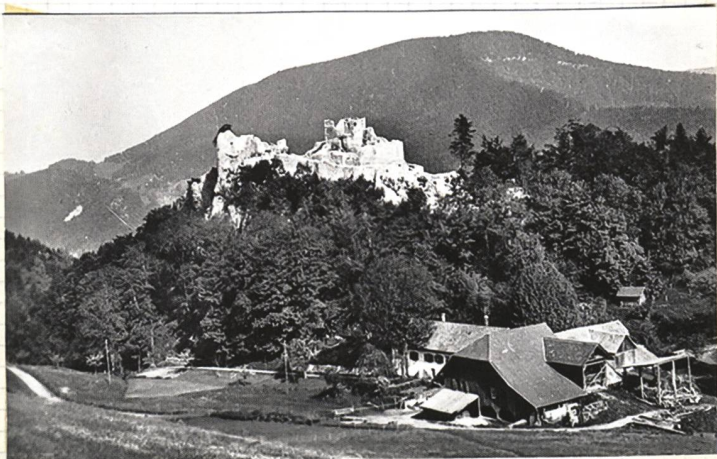
Alt Bedburg - Holderbank (So)

Stammitz des fahen Bedburg um's Jahr 1100 P. Hess