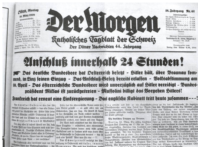
Der Morgen, 14. März 1938

Beim Durchblättern der Oltner Zeitungen fällt auf, wie sehr die weltanschaulich-politische Positionierung der Parteiblätter deren Berichterstattung prägte. Die Redaktion des Volkspartei-Organs «Der Morgen» stand dem christlichsozial-vaterländischen Regime, das in Wien seit 1932 an der Macht war, recht nahe. Der au-