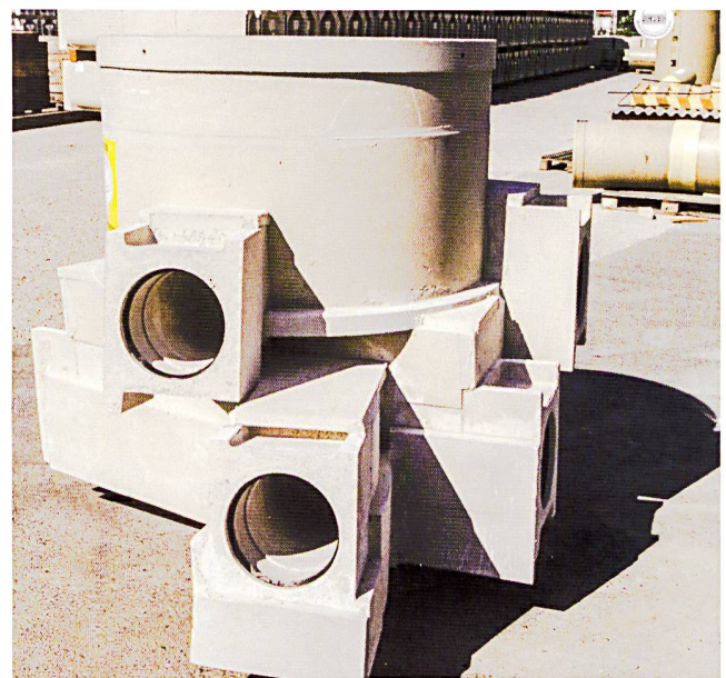
Fritschi-Schachtelemente aus der Polymerbeton-Elementfabrikation in Gunzgen

Kanalsanierung und Kanalinspektion Bauelemente in Polymerbeton Fenster- und Küchenbau Kompostierungen