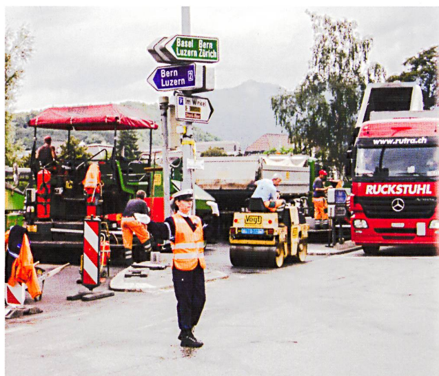
Postplatz Olten, 2005

1997 entschied sich Peter Fritsch für das Zusammengehen mit der Astrada, die nach der Übernahme der Vogt Strassenbau Olten im Kieswerk Gunzgen neuer