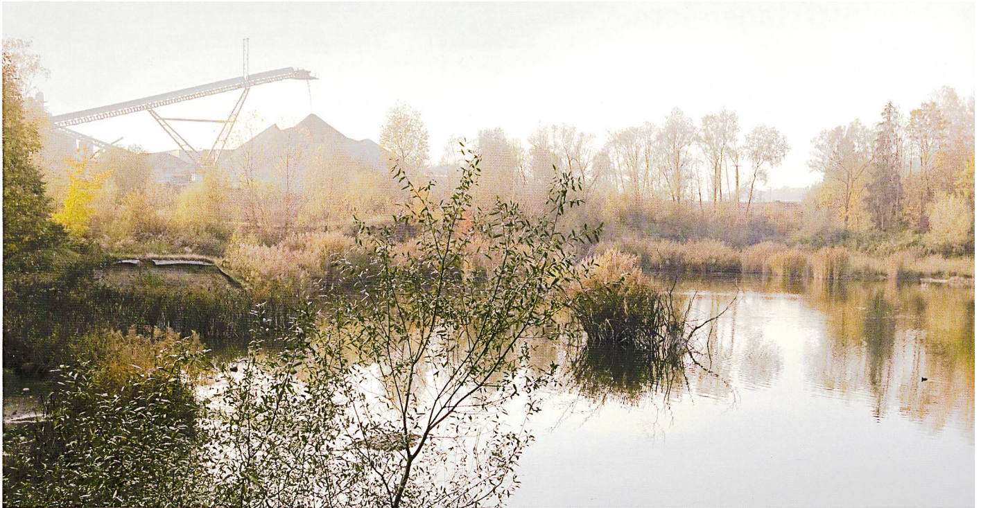
Werkplatz Kieswerk Gunzgen