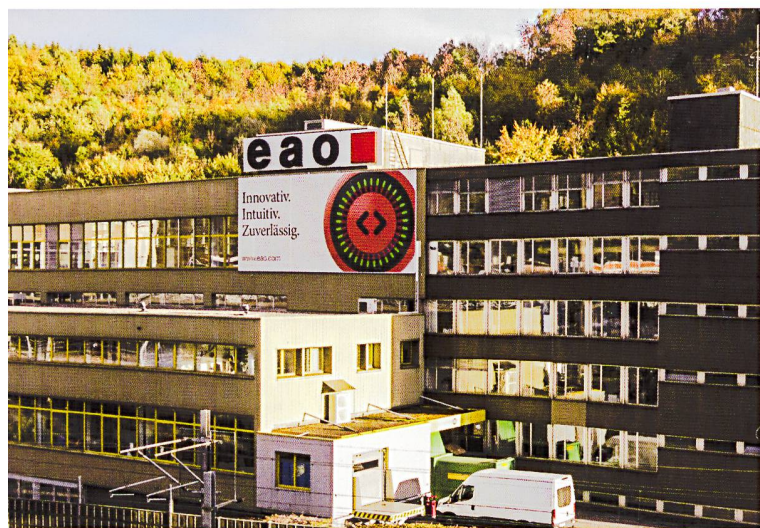
Vom Kleinstbetrieb zu einer der führenden Solothurner Industriefirmen: Die Oltner EAO AG erhielt den Solothurner Unternehmerpreis 2018.