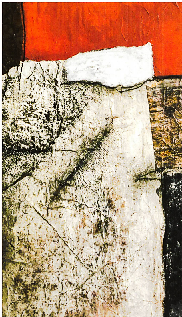
Ohne Titel, 34 × 55 × 2 cm

Magi Stürmlin ist eine höchst engagierte Künstlerpersönlichkeit, die mit Leidenschaft ihrer Malkunst nachgeht. Sie lebt, atmet und denkt für ihre Kunst; beim Gestalten und Malen ist sie hellwach und fühlt sich auf eine besonders vertiefte Art lebendig. Sie beginnt zu malen, oft ohne feste Vorstellung, lässt sich vom Augenblick inspirieren, beobachtet, hinterfragt und arbeitet weiter. Sie malt mit reinen Pigmenten, stellt sämt-