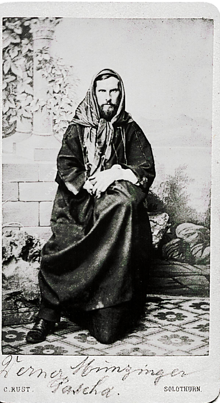
«Carte de visite» von Werner Munzinger Pascha.

dessen wurde er 1871 vom ägyptischen Vizekönig mit der Verwaltung der Unterprovinz Massaua betraut. Zwei Jahre später wurde er sogar zum Pascha der ägyptischen Gebiete im Sudan und am Roten Meer ernannt. Die vorhandenen Briefe zeigen, wie energisch Munzinger Projekte vorantrieb und wie sein Arbeitseifer von den Mitmenschen wahrgenommen wurde: «Wir machen jetzt rechts und links Ausflüge, um zu bestimmen, wo unsere Soldatenkolonie sitzen muss, wohin der Hafen kommen soll und dann (die) Eisenbahn (...) und manche andere Sachen, die alle leicht sind, wenn die Regierung mich zwei Jahre ruhig arbeiten lässt. (...) Die Leute gefallen mir nicht schlecht und ich ihnen auch nicht, wie es scheint, wenn die Eindrücke