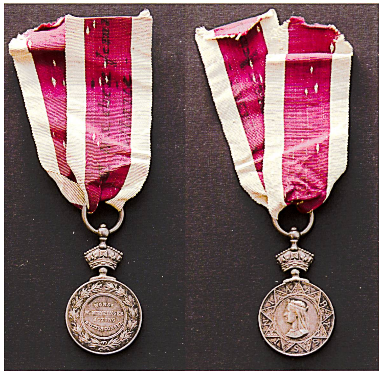
Verdienstmedaille für die Abessinienexpedition von 1868