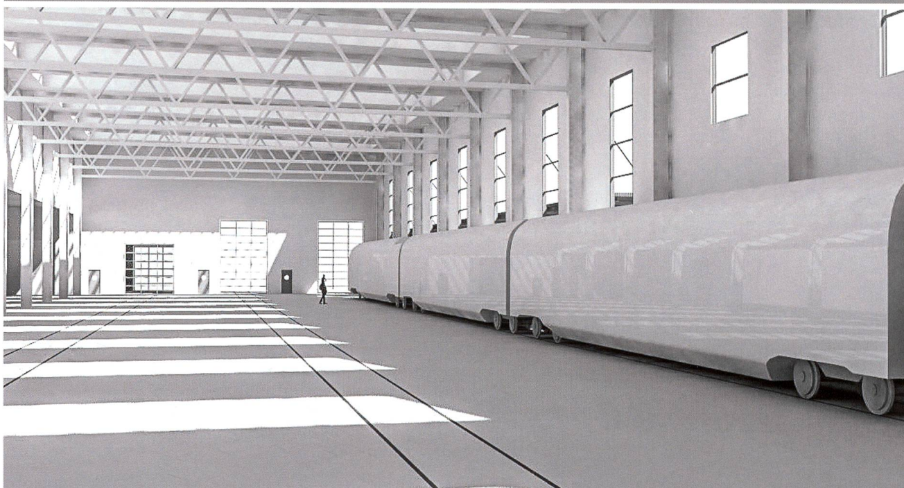
Im SBB-Werk Olten wird eine Halle mit Investitionen von rund 37 Mio. Franken angepasst, damit dort bis zu 150 Meter lange Trieb- und Gliederzüge gewartet werden können.

Baumann & Cie. eine Filiale. Im gleichen Monat verlegte der Schweizerische Handball-Verband seinen Sitz mit 15 Mitarbeitenden aus dem Haus des Sports in Ittigen bei Bern an die Tannwaldstrasse; gleichenorts zog auch die bisher in Bern domizilierte Stiftung Idée Suisse mit ebenfalls 15 Mitarbeitenden ein. Von Dietikon nach Olten kam der Verband Schweizerische Zentrale Fenster und Fassaden mit 18 Beschäftigten. Ein wichtiger Arbeitgeber in der Region, die Migros Verteilbetrieb Neuendorf AG, konnte zum Jahreswechsel ihr für über 67 Mio. Franken realisiertes Logistik Center Ost für Non-Food- und Fachmarkt-Artikel in Betrieb nehmen, in dem 18 Aussenlager konzentriert wurden. Leider gab es aus der Region auch Negatives zu berichten: Glas Trösch kündigte die Schliessung des Werks Trimbach an, das Prototypen und Kleinserien von Aussenverglasungen für Automarken der Luxusklasse herstellte, bis Ende Mai. 47 von 52 Mitarbeiten-