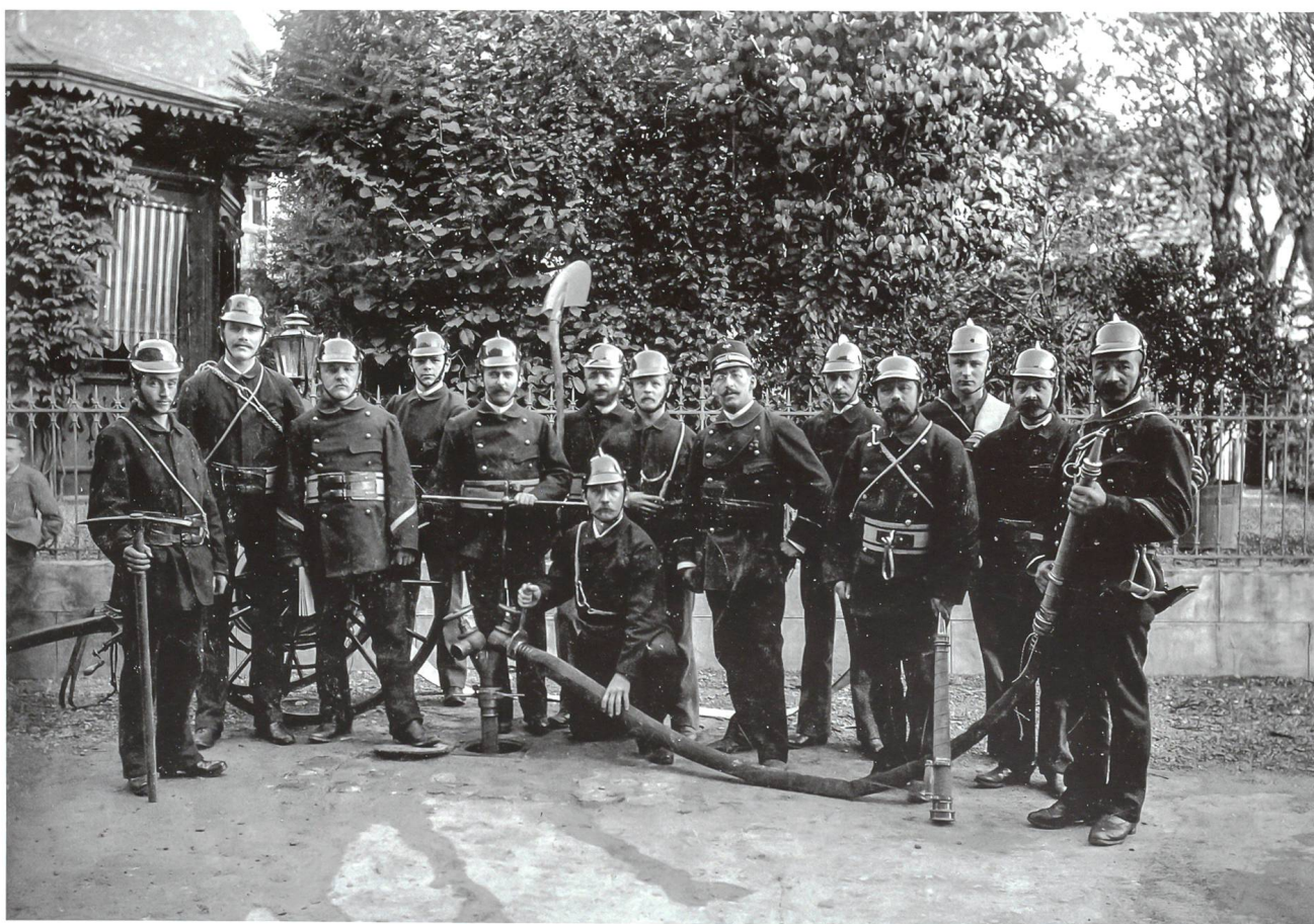
Feuerwehr Olten 1905

Trotz dieser Vorschriften gab es natürlich noch lange Holzhäuser. Ab 1555 wurden in Olten Feuerschauer eingesetzt. Ihre Aufgabe war es, Kamine und Öfen zu kontrollieren und mangelhafte reparieren zu lassen. Nachlässige Hausbesitzer wurden bestraft. Ab 1706