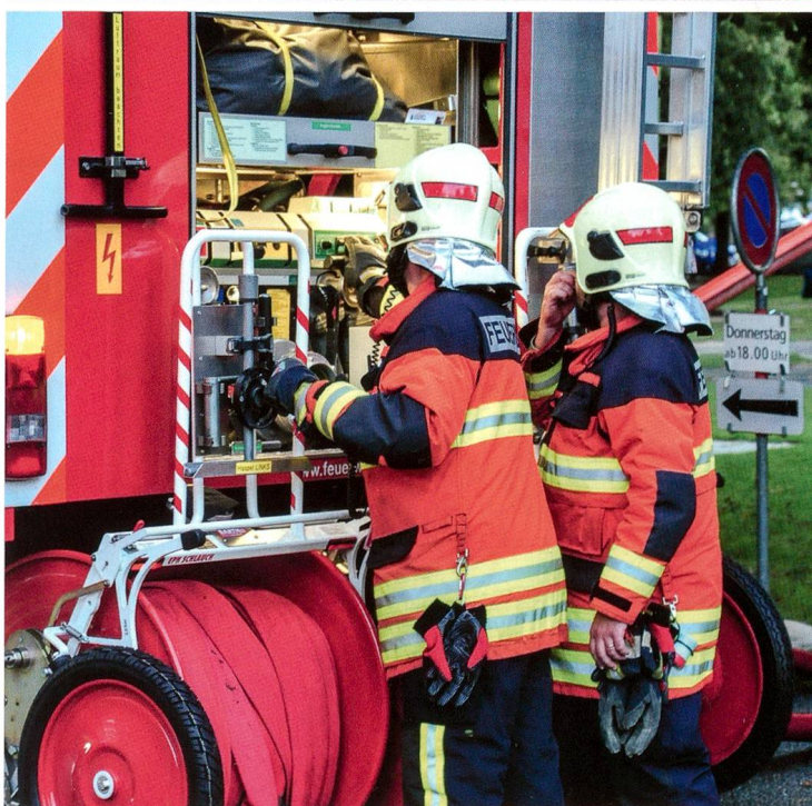
Feuerwehr Olten 2016