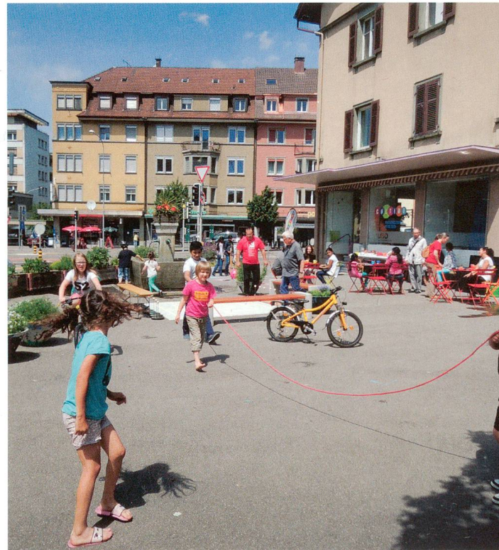
Das Begegnungszentrum Cultibo stellt die Plattform für Vernetzung und Integration auf der rechten Aareseite dar.

Ein wichtiges, zugleich auch sehr anspruchsvolles und daher vorerst nur in Ansätzen behandeltes Anliegen der ersten Phase war die Liegenschaftenerneuerung. Die integrale Strategie Olten Ost, die der Stadtrat im Oktober 2013 als zentrales Teilergebnis der zweiten Projektphase