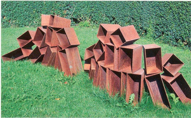
Gillian White, «Kartenhaus 4», 2014/15

Der Kunstverein Olten liess sich etwas Besonderes einfallen. Er organisierte im Klostergarten über die Sommerzeit eine Skulpturenausstellung mit zehn Solothurner Kunschtchaffenden sowie mit der in England geborenen und heute im Aargau lebenden Künstlerin Gillian White, welche die 1970 fertiggestellte «Gewässerschutzplastik» an der südlichen Quai-Mauer bei der Bahnhofunterführung Olten schuf, die eigentlich dringend restauriert werden müsste.