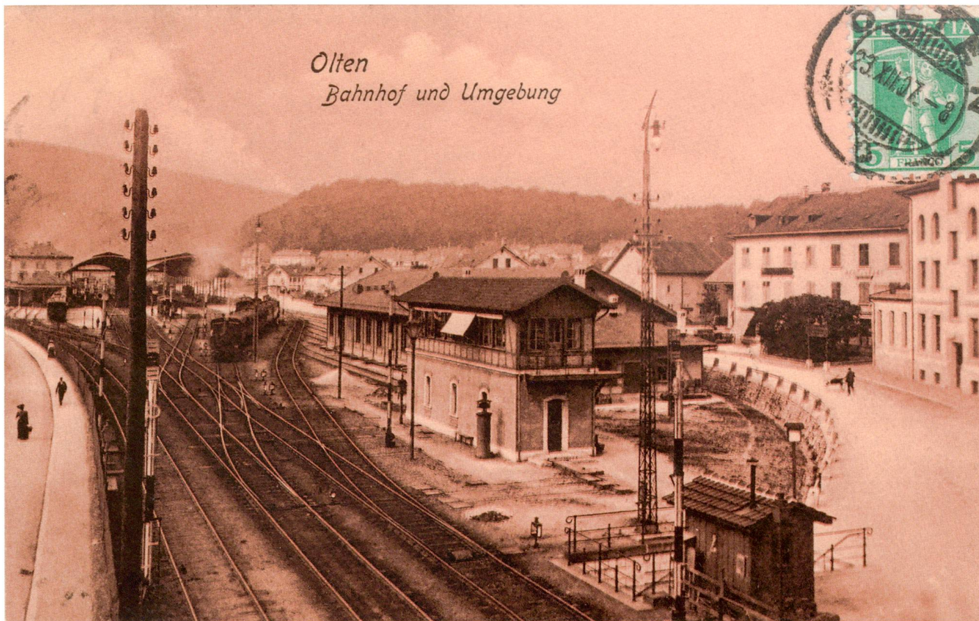
9 Olten, Hauptbahnhof m. Stellwerk Süd im Vordergrund. VD 23. 12. 1907. Herstellervermerk: Dr. Trenkler Co., Leipzig 1906 Olt. 3 (Serie)

wird anno 1899 erwähnt) 5 setzte offenbar im Hardegg-Quartier neue Massstäbe. Das zeigt auch der Vergleich mit den eher bescheiden anmutenden Doppel-einfamilienhäusern in der Oberen Hardegg im Hintergrund. Auch aus einem zweiten Grund ist die Karte sehenswert: Bei genauer Betrachtung zeigt es sich anhand von zahlreichen farblichen Ungenauigkeiten, dass es sich hier nicht etwa um einen Farbendruck handelt, sondern um eine von Hand kolorierte Karte, wie sie auch jener Mann eine Zeit lang hergestellt hat, den das Schicksal vom einfachen, aber wortgewaltigen NSDAP-Mitglied zum «Führer» Deutschlands und zum wohl schrecklichsten Despoten der zeitgenössischen Geschichte Europas hat werden lassen.