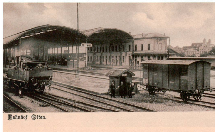
6 Olten, Hauptbahnhof innen. VD 31.10.1902.

Strasse das Bahnhofareal im Osten abgrenzte. Das Bild verdeutlicht auch sehr eindrücklich, wie die Bahn und die sich entlang der Bahnlinien ansiedelnden Industrie- und Gewerbebetriebe aus der «Pionierzeit» unsere Stadt in Alt- und Neu-Olten getrennt und zu zwei selbstständigen Stadtteilen gemacht haben. So ist es heute unmöglich geworden, von der linken auf die rechte Aareseite zu gelangen, ohne über eine Passerelle oder durch eine Unterführung gehen zu müssen!