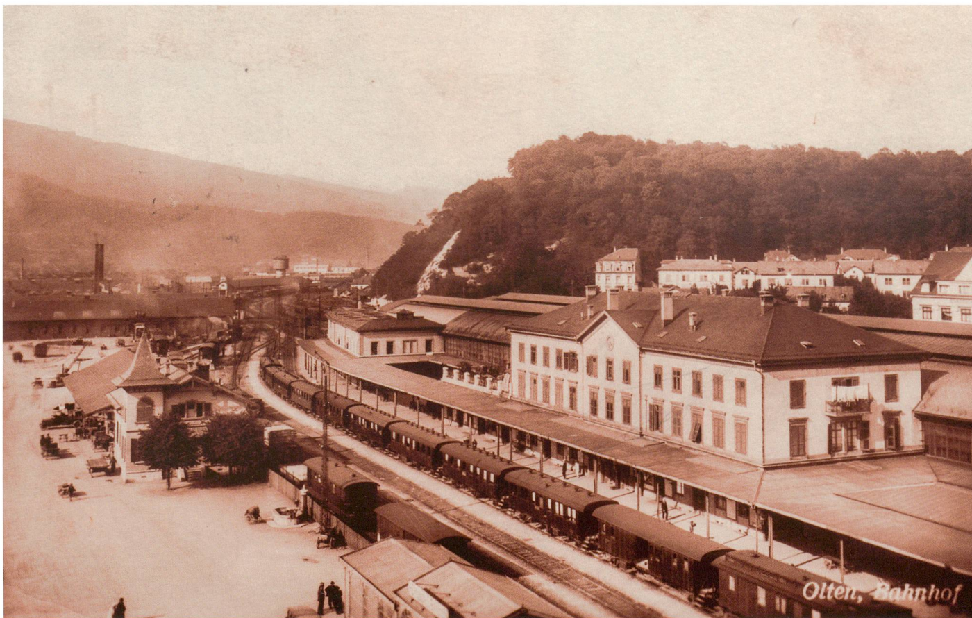
5 Olten, Hauptbahnhof ab Postgebäude. VD 25.4.1922. Hersteller- bzw. Vertriebsvermerk: U 2071

nerprovinz. Ihm ist glücklicherweise bisher das gleiche Schicksal erspart geblieben, dem kürzlich die heruntergekommenen, mehr oder weniger bewusst der Verwahrlosung preisgegebenen herrschaftlichen Fabrikantenhäuser an der Römerstrasse 3 zum Opfer gefallen sind. Ganz rechts am Rand die 1882 entstandene erste Bahnhofbrücke, die im Grunde Anlass zum Entstehen der Oltner «Akropolis» gegeben hat.