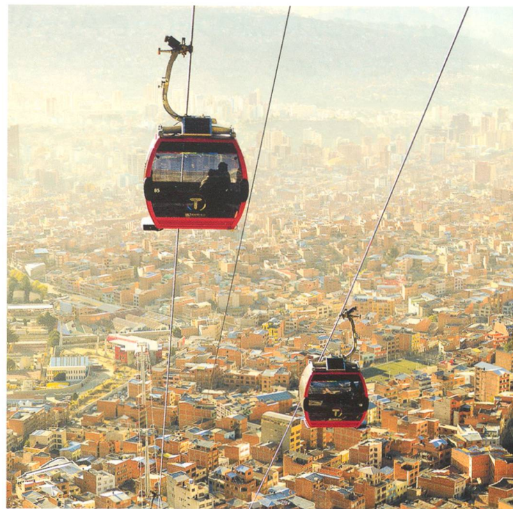
La Paz, Bolivien