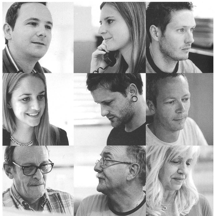
Die motivierte Führungscrew

Dem allgemeinen Trend «Alles aus einer Hand» entsprechend baut die Dietschi Print&Design AG auch ihre Designabteilung laufend weiter aus und entwickelt für die anspruchsvolle Kundschaft mit einem Team von kreativen Grafikern und Polygrafen Printprodukte und -projekte von der Idee bis hin zur Druckvorlagenherstellung. Immer häufiger haben die Kunden dabei auch den Anspruch, ihre Printprodukte ihrem Markt zusätzlich als App-Lösungen zu präsentieren, was mittlerweile ebenfalls eine Kompetenz des Oltner Druckunternehmens mit dem Motto «Mehr als eine Druckerei» ist.