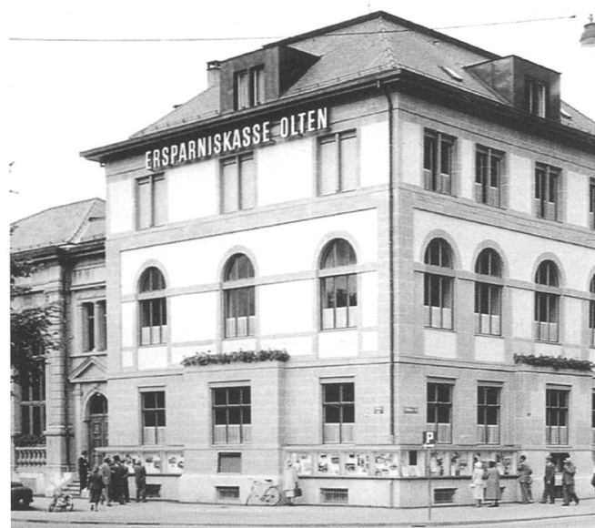
Das Gebäude der ehemalige Ersparniskasse Olten 1920 (oben) und 1960 (unten)

Bekannt ist aus der Fotosammlung Rubin und der Ausstellung der Oltnen Stadtbilder 2009 des Historischen Museums das Beispiel des linksseitigen Aareprospekts und hierin der Konzert- und Verwaltungsbau der vormaligen Ersparniskasse Olten nach Plänen des Malers und Architekten Gottfried Julius Kunkler, einem Schüler von Gottfried Semper (Semperoper Dresden, ETH Zürich). Der Vergleich der Zustände von 1920 und 1960 zeigt eine beispiellose und unentschuld bare Zerstörung eines historischen, stimmigen Ensembles. Rechtfertigend kann hier immerhin von einer bewussten, zeittypischen Gesamtintervention im Sinne einer stilistischen Adaption ausgegangen werden; trotzdem eine, zumindest aus der zeitlichen Distanz, nicht anders als missraten und dekadent zu bezeichnende Gesamtmaßnahme.