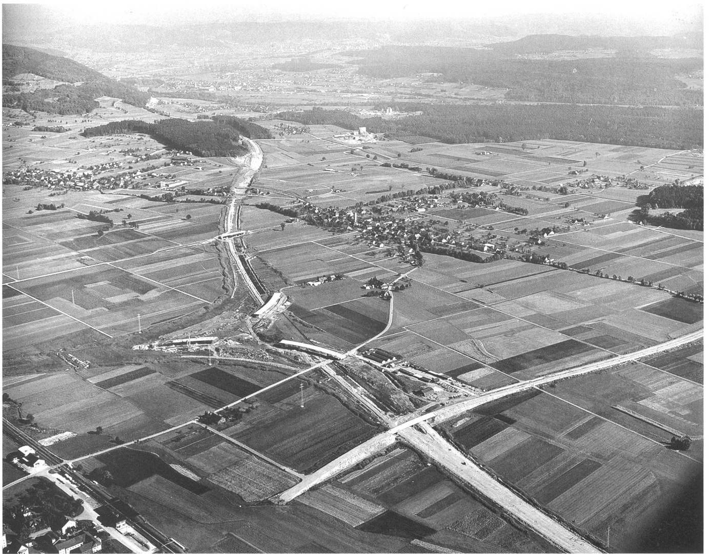
Die Autobahn A1 bei Härkingen im Bau

der Vision angesprochene Ikone lieferte dafür eine alte städtebauliche Utopie im Rang eines der (zahlreichen) sieben Weltwunder: die legendären hängenden Gärten der orientalischen Herrscherin Semiramis. Die Konzeption unterschiedlicher und nutzungsgetrennter städtischer Niveaus blieb städtebaulich virulent und vielerorts – leider oft zur rein funktionalen Massnahme degradiert – zur städtischen Realität.