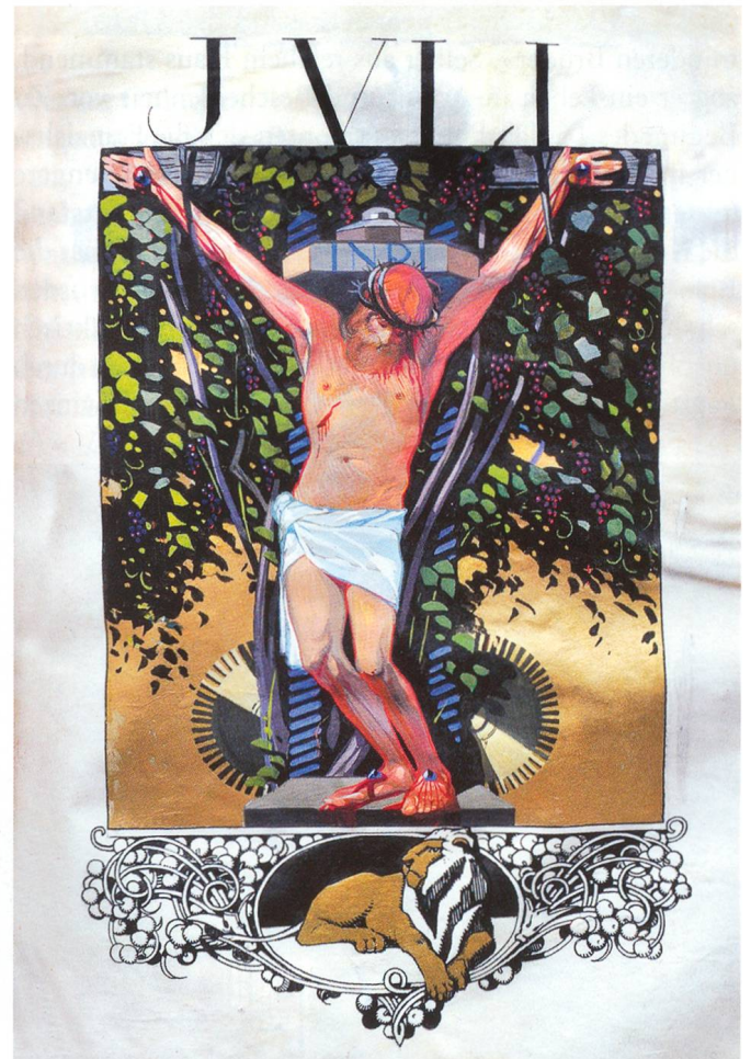
Monatsbild des JVLII. Christus in der Kelter. Vor einem Baum mit roten Weintrauben wird der am Querbalken angenagelte und von einem Pressholz mit der Kreuzesinschrift niedergedrückte Gekreuzigte in einer Weinpresse gemartert. Aus den fünf Wunden des Schmerzensmanns fliesst Blut. Blutüberströmt sind auch der Kopf mit der Dornenkrone und die Unterschenkel und Füße. Der blutige Kreuzestod Jesu (Mt 27,26.37) ist verbunden mit seiner unblutigen Vergegenwärtigung im Sakrament des Altars. Unten das Tierkreiszeichen des Löwen.

Die eindrucksvollen Monatsbilder im Oltner Jahrzeitenbuch können uns mahnend und ermutigend durch das Jahr begleiten. Unsere lieben Verstorbenen aber mögen ruhen im himmlischen Frieden!