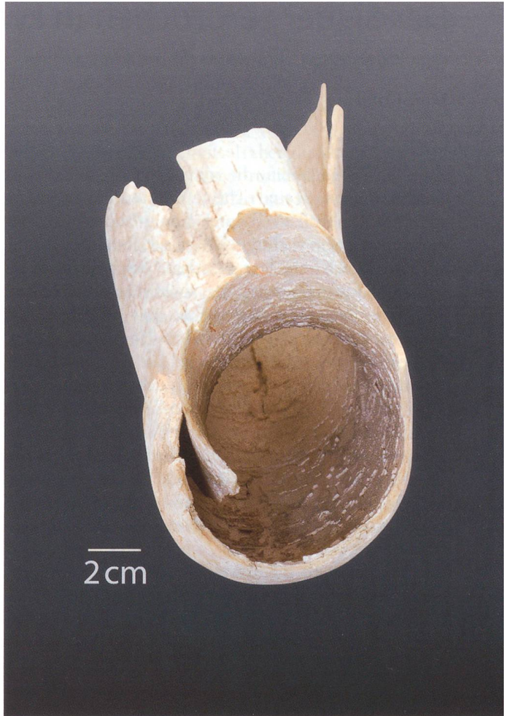
Das Stosszahnfragment des Wollhaarmammuts misst 65 cm in der Länge, 10 cm im Durchmesser und wiegt 1,1 kg. Effektiv war der Zahn dicker, weil die Ränder des hohlen und längs gespaltenen Fundstücks übereinander liegen.

Region, zum Beispiel vom Riesenhirsch ( Megaloceros giganteus ), vom Wollnashorn ( Coelodonta antiquitatis ), vom Steppenwisent ( Bison priscus ) und vom Wollhaarmammut ( Mammuthus primigenius ), die alle ausgestorben sind, oder vom Ren ( Rangifer tarandus ) und vom Moschusochsen ( Ovibos moschatus ), die heute nur noch im hohen Norden vorkommen. Die drei letzten Nachweise von Wollhaarmammuts stammen aus der Kiesgrube Gunzgen (Jahr 2003, Stosszahnfragment, NMO Nr. 26576/ETH-28441: 21000 \pm 120 BP, kalibriertes Alter 23700 bis 23050 v. Chr.), aus der Kiesgrube Hard in Däniken (Jahr 2008, Stosszahnfragment, NMO Nr. 26629/ETH-37528: 12920 \pm 50 BP, kalibriertes Alter 13600 bis 13050 v. Chr.) und wieder aus der Kiesgrube Gunzgen mit dem aktuellen Fund, der erstaunlicherweise viel älter ist als die beiden anderen. Der Stosszahn ist nur wenig jünger als die berühmten eiszeitlichen Funde von Niederweningen im Kanton Zürich und stammt aus einer nicht allzu kalten Zeit vor dem sogenannten Letzten Glazialen Maximum. Die Eiszeitkarte (Bild) zeigt die Häufung der Mammutnachweise in der Region Olten.