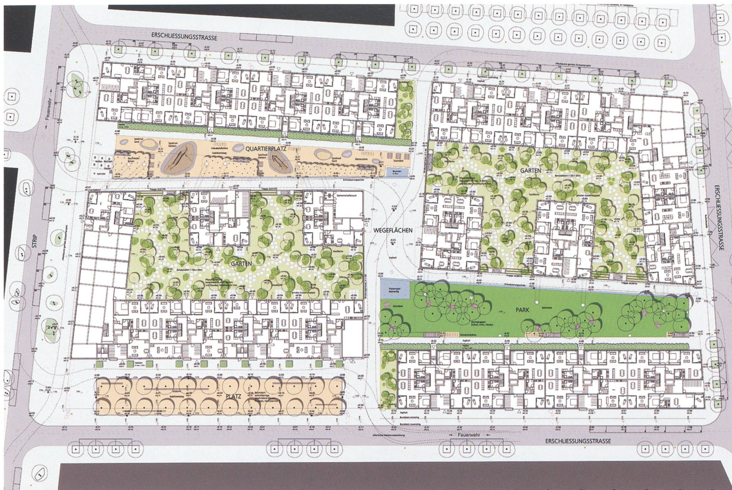
Bebauungsplan des Bereichs B4

37 Besucherparkplätze) in insgesamt acht Gebäuden: «Der Blockrand ist mit zwei Zeilen- und zwei Winkelbauten weitgehend geschlossen. In dem so entstandenen grossräumigen Hof ist eine Reihe von vier Punkthäusern eingestellt, die den Hofraum strukturieren. Die geschlossenen Blockecken antworten damit auf die Platz- und Parkstruktur des Gestaltungsplans. Die überzeugende Anordnung führt zu einer willkommenen Durchlässigkeit der Siedlung, ermöglicht wertvolle Durchblicke und schafft trotz hoher Dichte viel Licht im Innenbereich.» 12 Die Gebäudehöhe bis Dachkante nimmt Bezug auf die Geländehöhe des angrenzenden Gebiets im Gheid. Die von einer Bebauung frei gehaltenen Flächen innerhalb der Baubereiche können den angrenzenden Gebäuden als Ausenanlagen dienen oder als öffentlich zugängliche Flächen. Der Charakter des Stadtquartiers Olten SüdWest soll wesentlich vom Zusammenspiel der überbaubaren und frei bleibenden Flächen geprägt sein. Die Bauherrschaft hat die Absicht, sukzessive ein Quartier entstehen zu lassen, welches Raum für Gewerbe und Wohnungen sowie, je nach Bedürfnis der Stadt Olten, auch für Einrichtungen für die Öffentlichkeit (Schulen, Kindergarten, Kinderhorte, Spielplätze) gewährleistet... Dass zu einer Überbauung dieser Gesamtgrössenordnung eine sorgfältige und differenzierte Entwicklung gehört, ist für die Bauherrschaft eine Selbstverständlichkeit. Die Bauherrschaft freut sich, mit dieser Phase einen ersten Schritt in der Wohn-