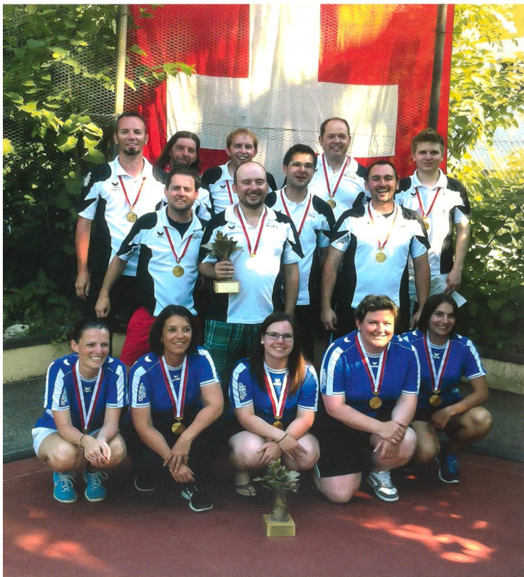
Minigolf Club Olten

Der Minigolf Club Olten feierte den grössten Erfolg seiner Vereinsgeschichte. Am Final-Spieltag der Nationalliga A in Gerlafingen sicherte sich das MCO Männterteam zum sechsten Mal in Serie den Meistertitel, das MCO Frauenteam holte nach Silber im Vorjahr zum ersten Mal die Goldmedaille. Die Qualifikation beider Teams für den Europacup nutzten die Damen zusätzlich mit einem zweiten Platz auf europäischem Niveau.