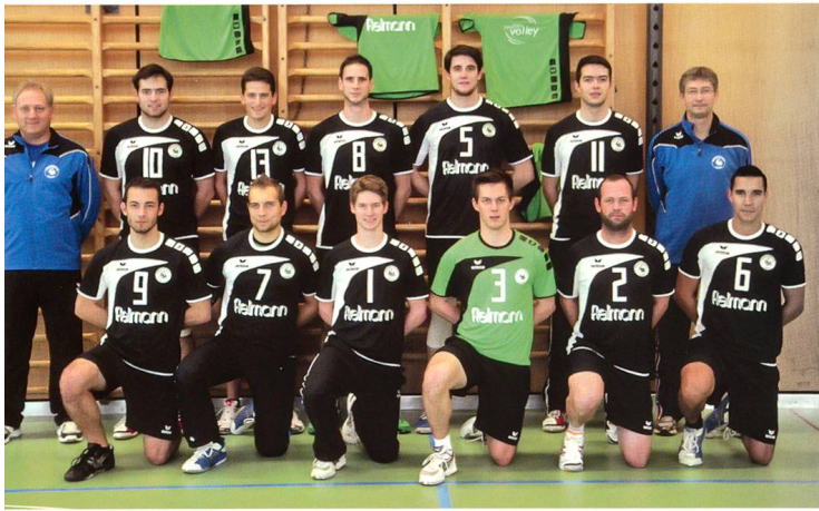
Die Volleyballer des SV Olten

wieder. Zusammen mit der zweiten Mannschaft duellierte man sich um die zwei Playoffplätze. Aufgrund von Rückzügen stiegen schliesslich beide Teams auf, und Olten hat damit ein neues Nationalligateam und bestreitet seine Spiele in der laufenden Saison in der NLB.