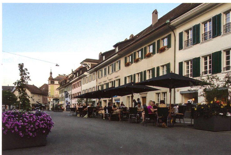
Die Aussencafés geben der Kirchgasse ein gastliches Gepräge und animieren zum geselligen Verweilen.

die gewandelten Rahmenbedingungen ein: «Wenn wir auf die Kirchgasse hinausblicken, sehen wir anstelle der lärmenden Autos zahlreiche flanierende Menschen. Welch ein Szenenwechsel im Vergleich zu vorher!» Und erfreulicherweise ziehen die positiven Einschätzungen weitere Kreise: Auch in der Altstadt sind höhere Frequenzen zu beobachten, wie mehrfach zu vernehmen war. Wenn die fröhliche Stimmung, die während des am 1. Juli gestarteten fünftägigen Eröffnungsfestes um sich griff, auch in der Folgezeit spürbar bleibt, dann ist das nicht zuletzt den initiativen Geschäftsinhabern und Museumsleitungen zu verdanken, welche mit ihren Ideen und Angeboten für Alt und Jung, Gross und Klein vielerlei verlockende Gründe schaffen, den Stadtkern aufzusuchen. Und auch die Verlegung des Marktes vom Munzingerplatz in die Kirchgasse ist vom Publikum wie auch von