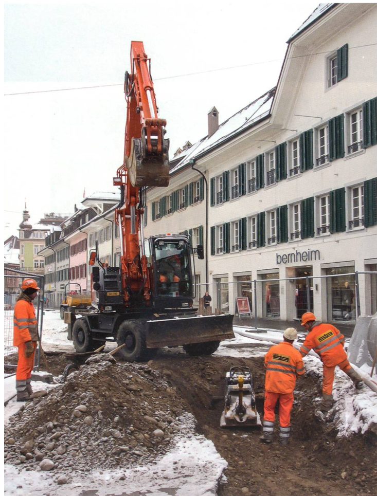
Während der Bauphase herrschten zeitweise winterliche Verhältnisse. Doch selbst der Schnee konnte die Bauleute nicht vom Arbeiten abhalten.

den zu hören, das bin ich mir eher nicht gewohnt. Umso erstaunlicher und erfreulicher mutet es deshalb an, wenn ausgerechnet jene Protagonisten am Rühren sind, welche die mit kontroversen Diskussionen, mit langwierigen Bauarbeiten und umständlichen Wegen und Zugängen gespickte Vorgeschichte tagtäglich und hautnah miterleben mussten. Und wir erinnern uns: Hauptgründe der gefühlten Skepsis waren weniger die langen Gräben für die zu sanierenden Werkleitungen oder die voluminösen Löcher für den Einbau einer modernen Infrastruktur – der Sinn und Zweck solcher Eingriffe war ja offenkundig und deren Ende absehbar –, sondern vielmehr die angesagte Verbannung des motorisierten Verkehrs aus der Kirch- und Mühlegasse, was zwangsläufig den Verlust mehrerer Parkplätze mit sich zog. Doch vergessen wir nicht, wie es überhaupt dazu kam. Nämlich, dass die Kirchgasse im Zuge der flankierenden Massnahmen zum Entlastungsprojekt Region Olten auf Geheiss des federführenden Kantons in eine Langsamverkehrszone umzuwandeln war. Und wer, allen voran die betroffenen Geschäftsleute in der Innenstadt, mochte zu diesem Zeitpunkt schon die in Aussicht gestellten Vorteile sehen? Die da wären: Kein Stau mehr, keine Abgase, keine Raserei, kein Lärm; dafür freie Sicht auf eine grosszügige, offene Szenerie und reichlich Platz für Aussenaktivitäten in mannigfaltigen Formen, Strassencafés und last, but not least spontane