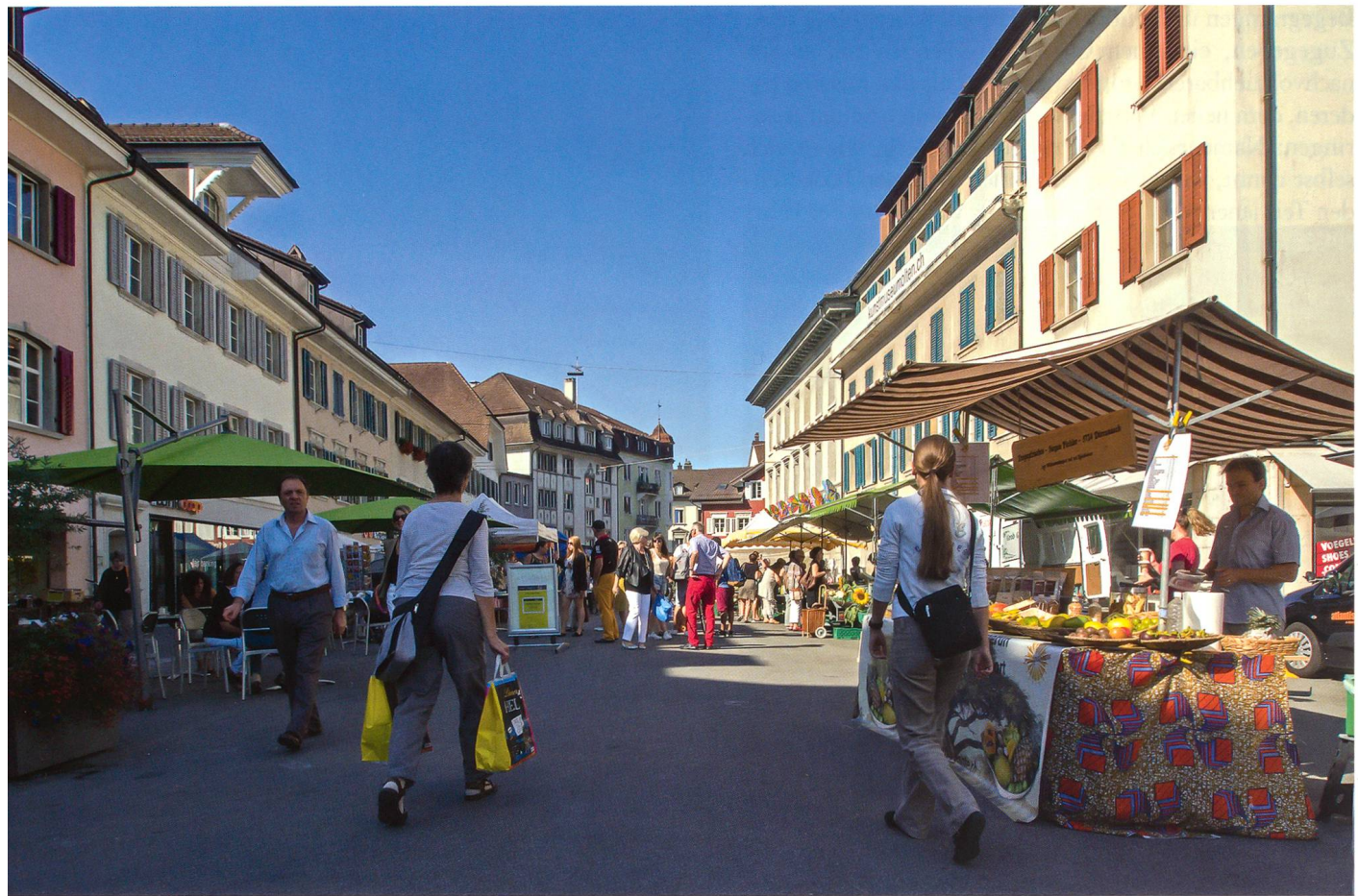
Die Verlegung des Wochenmarktes in die Kirchgasse hat sich förmlich aufgedrängt. Dadurch wurde der beliebte und stark besuchte «Märit» sichtlich aufgewertet.

den Marktfahrenden gut aufgenommen worden. Auch dies ist ein Indiz dafür, dass es sich lohnt, Veränderungen erst mal eine Chance zu geben. Klar ist in der Innenstadt auch so nicht jeden Tag und von morgens bis abends ein pulsierendes Leben zu beobachten.