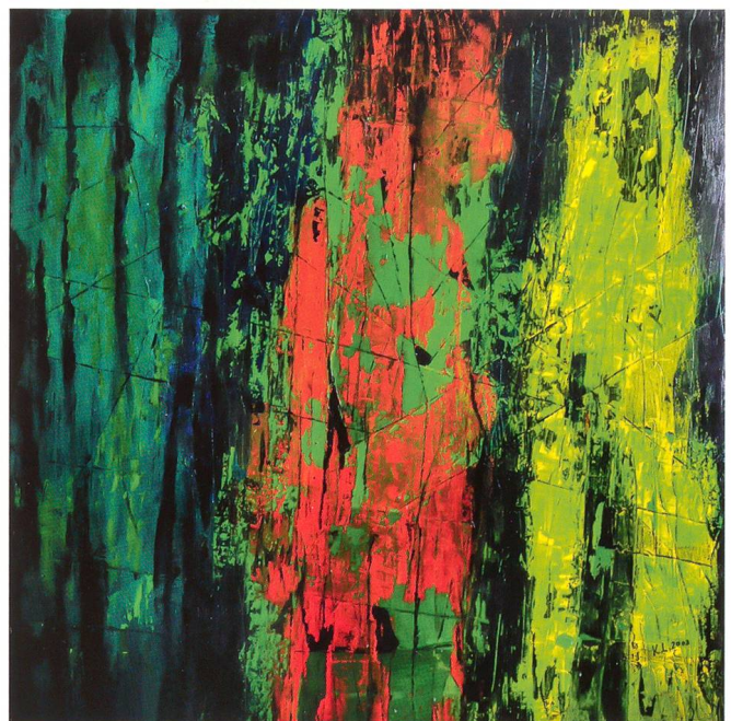
Kurt Lang, Abstrakte Kompositionen, Mischtechnik auf Leinwand