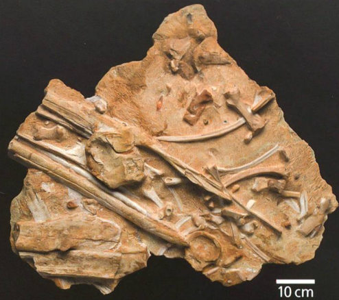
Zerfallene Schädel- und Skelettreste des «Bornsauriers» zusammen mit Fragmenten verschiedener anderer Tiere, wie dem Flossenstachel eines grossen Hais, diversen Haifischzähnen sowie Resten eines Meereskrokodils und eines anderen Fischesauriers. Sammlungsnummer NMO 26630.

zerbrochene Knochenstücke konnten wieder zusammengefügt werden. Es stellte sich heraus, dass der Fund entweder zu einer sehr seltenen, wenig erforschten und bisher nur aus England und Russland bekannten Ichthyosauriergattung mit Namen Brachypterygius gehört oder gar etwas völlig Neues darstellt. «Für mich – und ich beschäftige mich seit mehr als 15 Jahren intensiv mit Ichthyosauriern – ist das ein hoch spannender Fund und eine wertvolle Ergänzung der bisherigen, eher spärlichen Kenntnisse über die oberjurassische Ichthyosaurierfauna Westeuropas», so Maisch, der die Präparation des Stückes wissenschaftlich betreute.