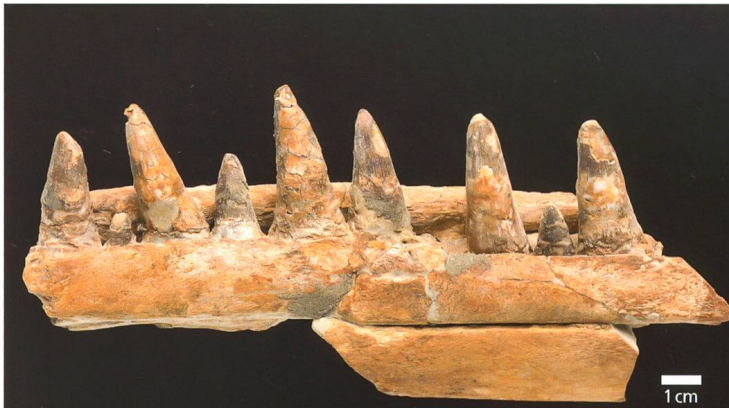
Teil des Unterkiefers des «Bornsauriers». Die kräftigen, spitzen Zähne weisen ihn als erfolgreichen Räuber aus. Für Ichthyosaurier typisch sind die Zähne in einer durchgängigen Rinne befestigt. Sammlungsnummer NMO 26631.