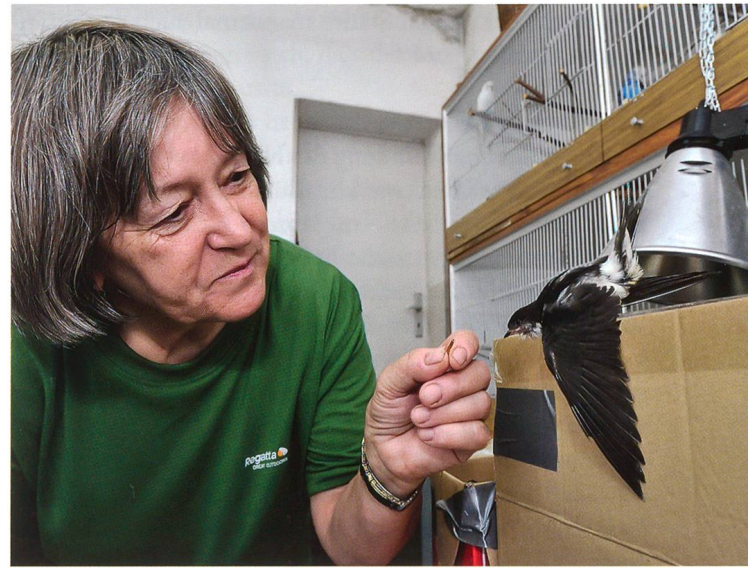
Mitarbeiterin mit genesender Schwalbe