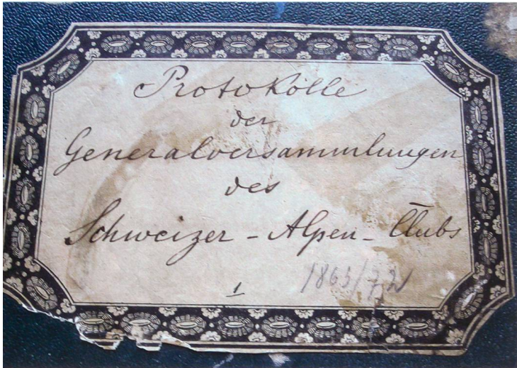
Titelticket des ersten SAC-Protokollbuches 1863–1872

«Nachdem man mit den verschiedenen Bahnzügen in Olten, diesem ομφαλος der Schweiz, angelangt (war)» Olten zum Nabel der Schweiz erklärt – Ausschnitt aus dem Protokoll des SAC vom 19. 4. 1863