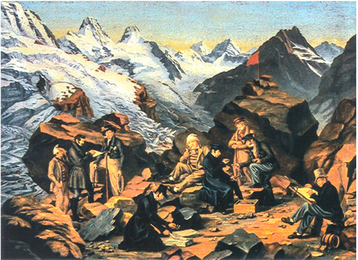
Franz Joseph Hugi und seine Begleiter im Rottal 1830 von Martin Disteli – Alpines Museum Bern

lung bis am Mittag die Vereinsgründung, bestellte einen Vorstand und versah Präsident und Komitee mit den nötigen Aufträgen und der Vollmacht, demnächst zu einer konstituierenden Tagung nach Glarus einzuladen. Sogar ein Statutenvorschlag wurde kurz beraten, ein Signet besprochen und die Namensfrage geklärt. Darauf konnte man zum geselligen Teil übergehen. Auch dieser Tagungsbereich wurde protokolliert und soll wegen seiner Eigentümlichkeit im Wortlaut wiedergegeben werden.