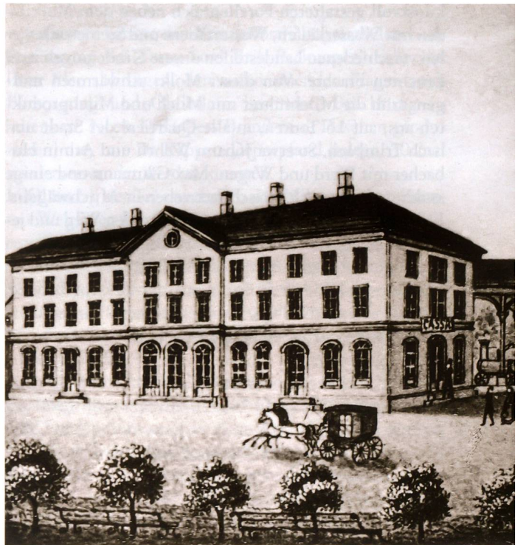
«Der Nabel der Schweiz» – im Bahnhofgebäude wurde 1863 der SAC gegründet. – Skizze vor 1875