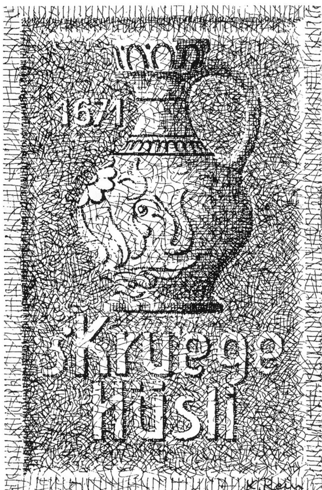
Karl Rein, Entwurf für das Hauszeichen am Haus Zielempgasse 6 25

In das Kapitel «halbe Wahrheiten» gehören auch Evidenzschlüsse, d. h. Schlüsse, die aus zwei quellenmässig belegbaren, zeitlich aber weit auseinanderliegenden Fakten gezogen werden. Von einem solchen Evidenzschluss zeugt zum Beispiel die Bildtafel an dem kleinen Häuschen unterhalb der Jugendbibliothek oder des früheren Gefängnisses an der Zielempgasse in Olten. Sie zeigt einen wahren Krug und die Jahrzahl 1671 20 , darunter die Inschrift «s Kruege Hüsli». Die Tafel, ein Entwurf des ehemaligen städtischen Hochbautechnikers Karl Rein, wurde seinerzeit in der Kunststeinfabrik Adolf Schenker ausgeführt, wie ein Artikel im Oltner Tagblatt zu berichten weiss. 21 Sie nimmt Bezug darauf, dass im 17. Jahrhundert (anno 1664) ein Heinrich Krug in der Fröschenweid ein Haus erworben hat, 22 und darauf, dass sich offenbar dieses Häuschen gegen Ende des 19. Jahrhunderts «noch immer» im Besitz der Familie Krug befand. Bloss, und das hat Dr. Hugo Dietschi, den dieser Umstand zu seinem Zeitungsartikel veranlasste, übersehen, heisst es im Grundbuch von 1825, der damalige Besitzer, Josef Krug, der Sohn des Schneidermeister Conrad Krug, habe die Liegenschaft am 1. Oktober 1803 leibgedingsweise ohne Preis von Josef Bürgi erkaufte. 23 Ein Blick in das Grundbuch von 1825 hätte also den Schreiber davor bewahren können, Anlass zu geben zur Anbringung einer Tafel, die eigentlich jeder Grundlage entbehrt. 24