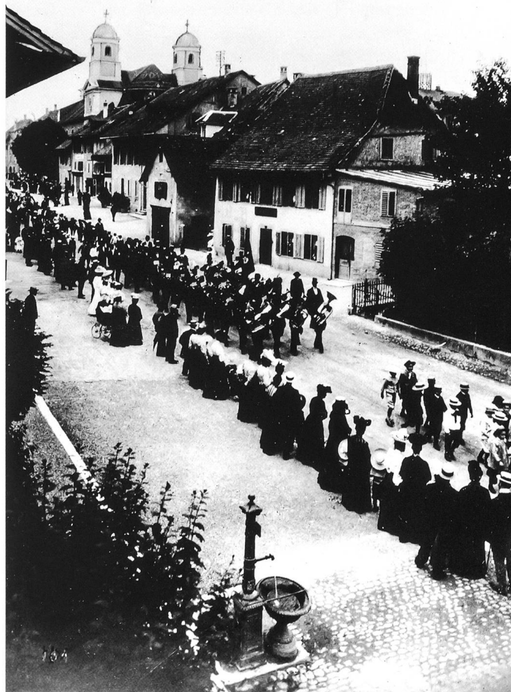
Gusseisener Brunnen an der Baslerstrasse: Schulfest 1906