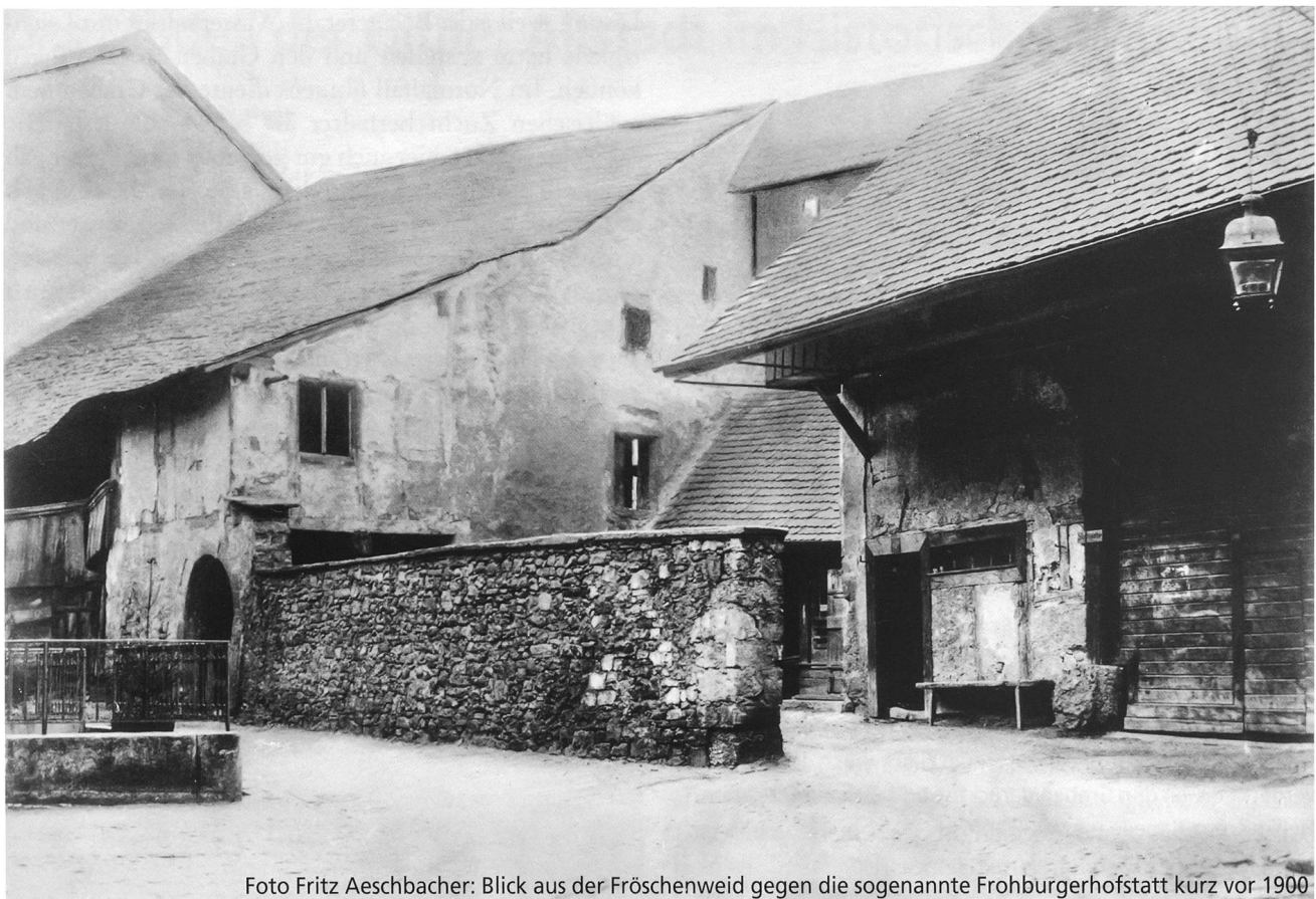
Blick aus der Fröschenweid gegen die sogenannte Frohburgerhofstatt kurz vor 1900

sind die Schüttstein- und Klo-Abläufe] fallen und die alten Ringmauern ein der Neuzeit entsprechendes Kleid anziehen werden.» 7