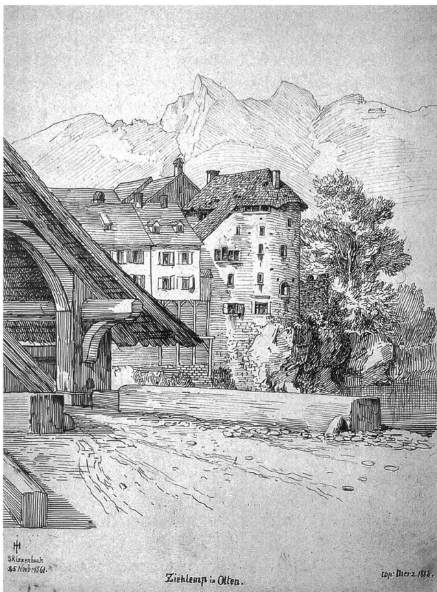
Heinrich Jenni: Ansicht des Zielemptenschlosses vor dem Teilabbruch von 1668

Wie weit der «Kaplaneigarten» reichte, der anlässlich der Aufhebung der Kaplanei um 1876 zu einem öffentlichen Platz umgestaltet worden ist, 11 lässt sich nicht genau festlegen. Es gibt von ihm nur eine skizzenhafte von Theodor