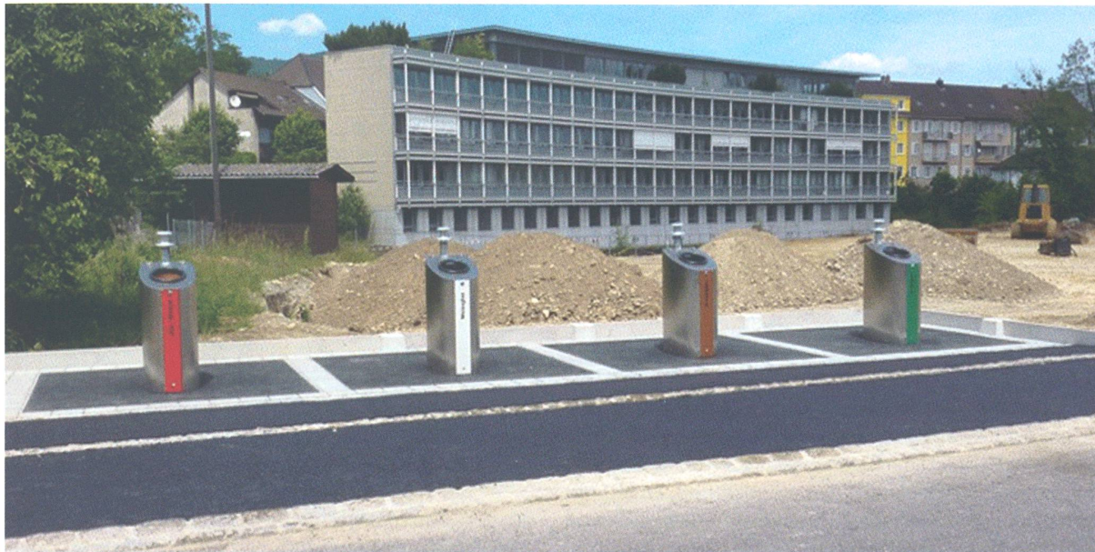
Dezenter als die bisherigen Container, die modernen Sammelstellen für Glas und Blech beim Werkhof

Mit welcher städtischen Behörde verbinden Sie diese drei Begriffe: Gärtnerei, Liegenschaftsunterhalt, Stadtentwicklung? Nicht ganz einfach zuzuordnen, wie? In der Tat ist der Tätigkeitsbereich der Baudirektion der Stadt Olten vielfältig und so mancher Bürger, und so manche Bürgerin staunt wohl beim Blick auf die vielen verschiedenen Aufgaben, welche die fünf Abteilungen der Direktion – Hochbau, Tiefbau, Werkhof, Stadtplanung, Administrative Dienste – erfüllen. Die drei eingangs genannten sind nur ein winziger Ausschnitt.