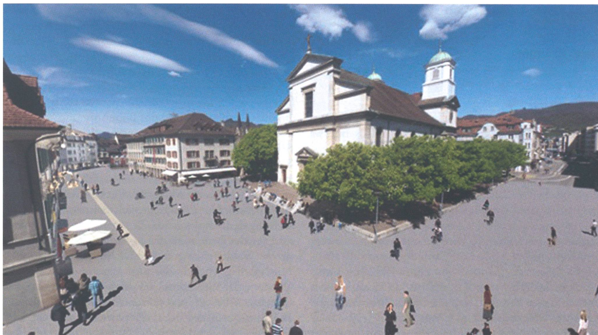
Nach der 2010 zurückgewiesenen Vorlage «Attraktivierung Innenstadt» griff der Stadtrat mit «Strategie Innenstadt 2012» einen neuen Ansatz zur Weiterentwicklung der Innenstadt auf, dem die Oltnen Bevölkerung zustimmte.

abteilungsübergreifend bearbeitet werden. 2013 steht der Start von gleich drei solchen Vorhaben an: