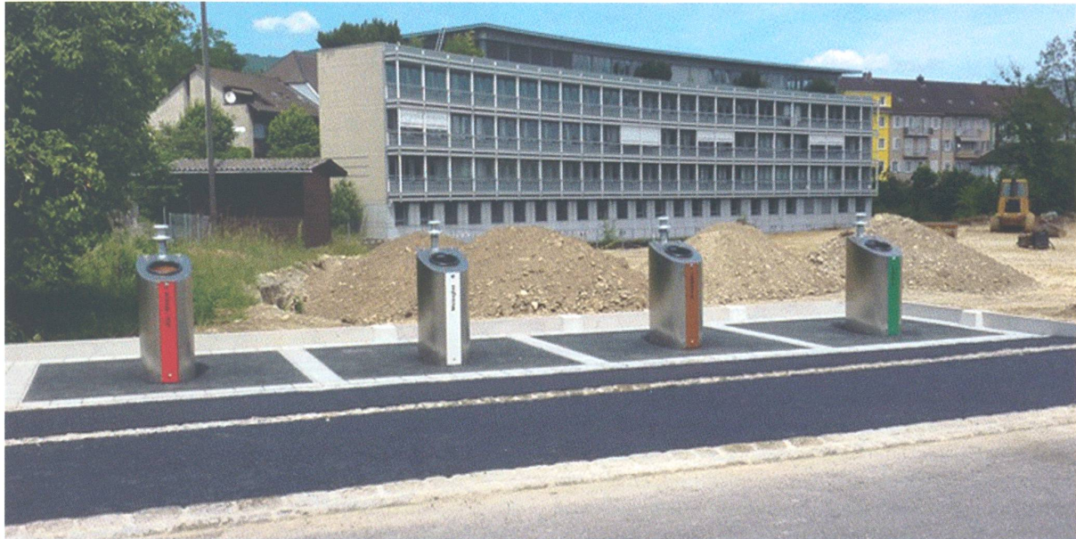
Dezenter als die bisherigen Container, die modernen Sammelstellen für Glas und Blech beim Werkhof

Mit welcher städtischen Behörde verbinden Sie diese drei Begriffe: Gärtnerei, Liegenschaftsunterhalt, Stadtentwicklung? Nicht ganz einfach zuzuordnen, wie? In der Tat ist der Tätigkeitsbereich der Baudirektion der Stadt Olten vielfältig und so mancher Bürger, und so manche Bürgerin staunt wohl beim Blick auf die vielen verschiedenen Aufgaben, welche die fünf Abteilungen der Direktion – Hochbau, Tiefbau, Werkhof, Stadtplanung, Administrative Dienste – erfüllen. Die drei eingangs genannten sind nur ein winziger Ausschnitt.