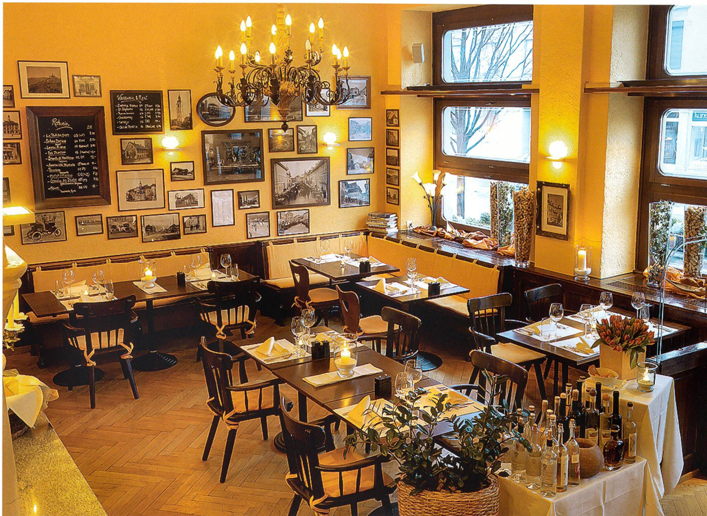
Die Brasserie des Restaurant Salmen