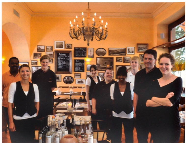
Stucksaal, Weinkeller und Belegschaft des Salmen