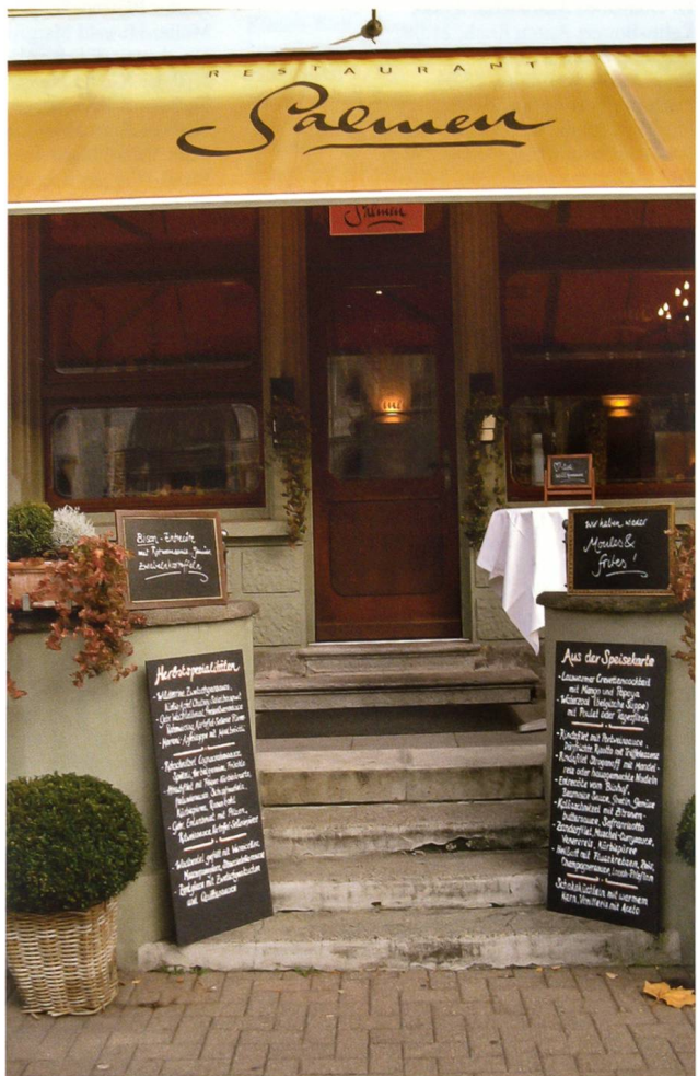
Aufsetzen des Kupfertürmchens und Eingang des Salmen