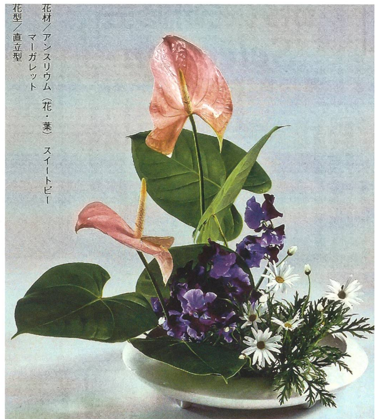
Arrangement in einer flachen Schale aus drei Materialien: 2 Anthuriumblüten, 5 Anthuriumblätter, 3 Zweige lila Wicken und 5 weisse Margeriten; die Schriftzeichen nennen die drei Materialien.

Für vieles fehlt mir heute Zeit und Gelegenheit, aber auf dem BLUMENWEG bin ich bis heute geblieben und hoffe, auch nächstes Jahr wieder an einem Meisterseminar in Tokyo teilnehmen zu können. Ich habe in Basel sehr treue Schüler und Schülerinnen, die schon lange Jahre meinen Unterricht besuchen.