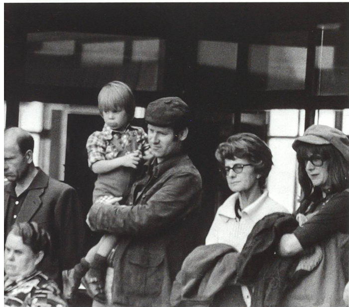
Oben: Franz Hohlers « Ichduersiees ». Eine szenische Elementargrammatik für 14 Personen