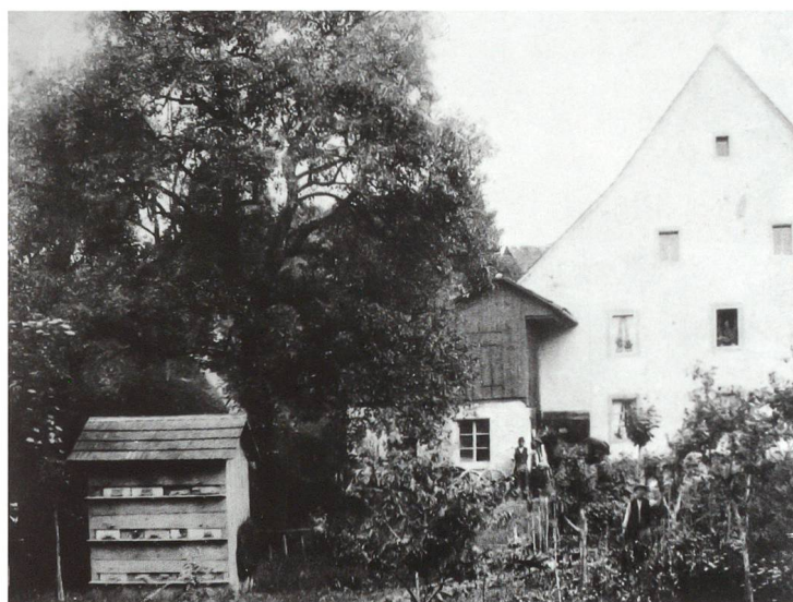
Oben: Strassenführung bis 1963. Am linken Bildrand Dachvorsprung und Miststock des alten Studerhofes