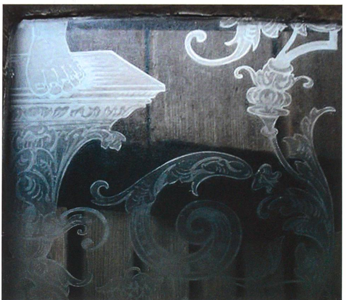
Die aufgefundenen Fenster: v.o.n.u. Adonis in Himbeerranken, Rest eines Rankendekors, Adonis' Fuss auf edlem Kapitell