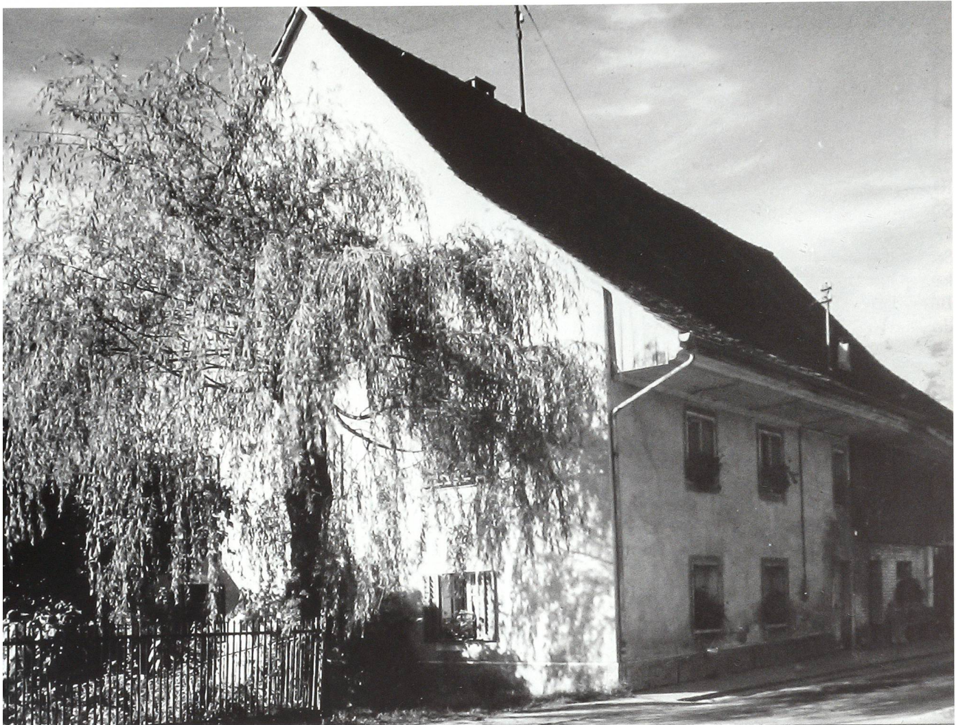
Der Studerhof in Hauenstein bis 1963