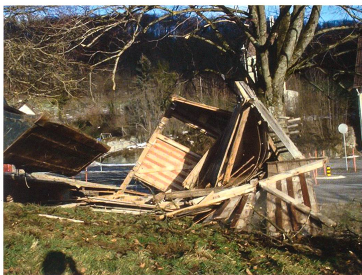
Nach über 60 Jahren ausgedient und mit dem Traktor eingerissen.