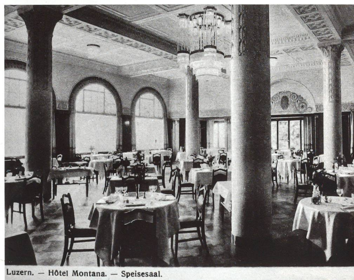
Luzern. — Hôtel Montana. — Speisesaal.

Das Hotel Montana in Luzern und sein damaliger Speisesaal fand man. 4 So wurden allmählich auch die geätzten Teile der Verglasungen auf die Oberlichter und die Seitenfüllungen der Türen verdrängt.