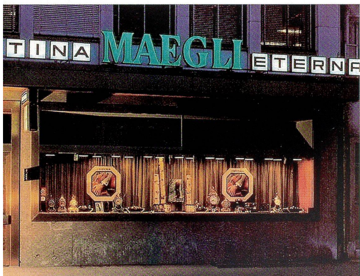
Das Geschäft an der Römerstrasse um 1975

Der nächste grosse Sprung gelang 1992 mit dem Umzug des einstigen Stammladens von der Römerstrasse in die Hauptgasse. Am oberen Eingang der Altstadt, gegenüber der ehemaligen Krone und diagonal zur Stadtkirche an allerbesten Lage befindet sich noch heute die Bijouterie Maegli. Der doppelstöckige Eckladen mit den grossen Fenstern und der imposanten Fassade ist nicht zu übersehen und entspricht auch äusserlich dem hundertjährigen Bestehen. Hier stand einst der Gasthof «zum Thurm», der über Hunderte von Jahren hinweg das Transitgeschehen in Olten prägte. Der Prunkbau von heute, das Geschäftshaus «zum Obertor», entstand um 1904. Mit den über zwei Etagen hohen Schaufenstern, dem neubarocken Oberbau und der zierlichen Zwiebelkuppel auf dem Dach ist dem Haus «zum Obertor» das grossstädtische Flair