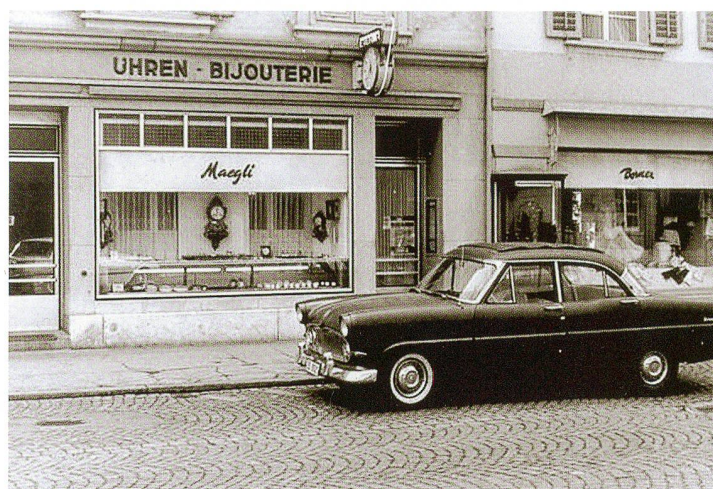
Das Geschäft an der Kirchgasse um 1955