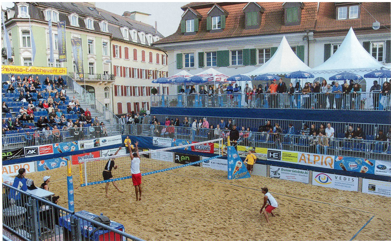
Beach-Event: Center Court vor einmaliger Kulisse

Nach gesundheitlichen Schwierigkeiten meldete sich Koni von Allmen in der Multisportszene mit dem 7. Rang im Abu Dhabi Adventure Race (6-Tage-Abenteuer-Rennen) sowie dem 2. Rang am internationalen Ironman in Eilat auf beeindruckende Weise zurück.