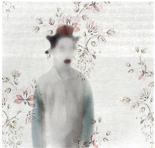
Aus der Serie «Childhood», Pigmentdruck, 2010, 70 x 70 cm

Andrea Nottaris wird von einem Thema derart gepackt, dass sie nicht mehr davon los kommt, bis sie es umgesetzt hat. Manchmal in einer Form, die sie am Anfang noch gar nicht voll erkennt. «Feuer und Flamme, mich brennts!» ist eine ihrer Aussagen, und dann taucht sie ab in ihre gestalterischen Welten. Allmählich spürt sie, dass sie den Weg zur kreativen Verwirklichung findet. Es sind dies intensive Prozesse, die unglaublich viele Bilder und Kräfte wecken, die hellwach machen, für neue gestalterische Ideen. Ein hektisches Arbeiten beginnt, Nähe und Distanz sind Komponenten, die sich gegenseitig ausloten. In der Distanz zu sich selbst erkennt sie Dinge, die sie nicht für gut genug findet, in der Nähe spürt sie mit grosser Sicherheit, was genau so sein muss.