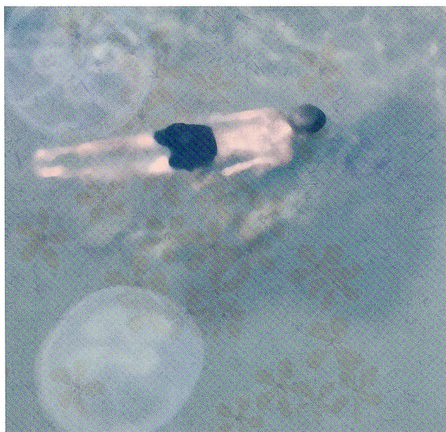
Aus der Serie «Childhood», Pigmentdruck, 2010, 70 x 70 cm