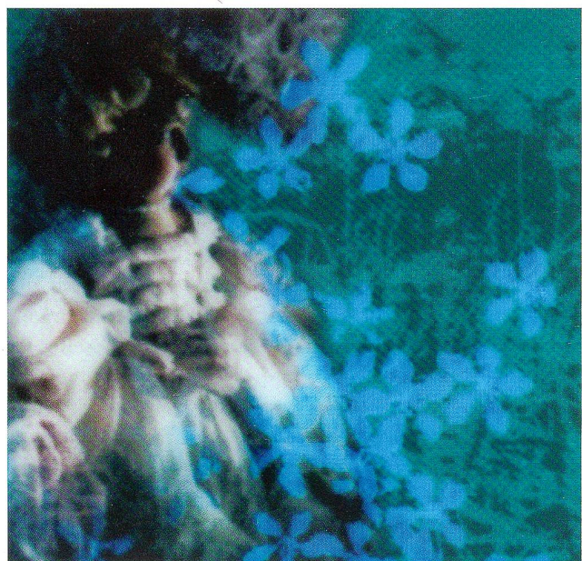
Aus der Serie «Le Secret», digital Airbrush auf Glas, 2010