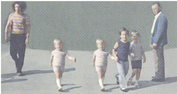
Childhood, Away, Pigmentdruck, 2009, 70 x 140 cm

Sie liebt es, Rauminstallationen zu kreieren. Gleich einem Patchwork an Ideen zeichnet sie erzählerische Momente auf, schmückt damit eine ganze Wand und macht daraus einen «Livingroom», wie dies am Kunstmarkt auf der Alten Brücke im vergangenen Jahr geschah. Die kleinen Bilder erinnern an zarte Lebenszeichen im Raum, man nimmt das Bild in die Hände, so als möchte man bewusst oder auch unbewusst einen Atemzug Leben festhalten. Es ist dies ein spannender und berührender Vorgang.