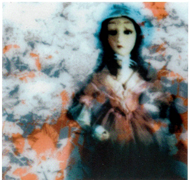
Aus der Serie «Le Secret», digital Airbrusch auf Glas, 2010