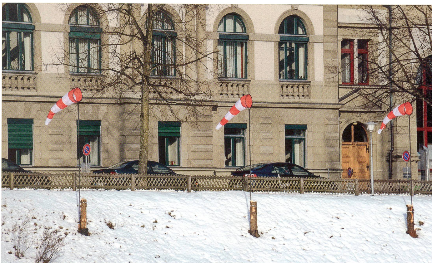
Was ist von den drei Oltner Weihnachtstannen geblieben? – drei Baumstrünke mit Windfahnen!

mehr zahlreichen Unternehmen und Banken zur unkontrollierbaren Selbstständigkeit verhelfen? Stehen wir also vor einer notwendigen Neuorientierung der bestehenden, die vor allem auf dem Zwang von immer mehr Eigen- gewinn beruhen? Wer erinnert sich noch an die Gründung der damaligen Genossenschaften zur Behebung der Not-situation ganzer Bevölkerungskreise? Statt nur zu bezahlen, wurden sie direkt am Umsatz beteiligt. Doch statt sich zusammen zu schliessen; zerfällt unsere Gesellschaft mehr und mehr in Polaritäten und gibt dem Eigeninteresse vor dem Gesamtwohl den Vorzug; weil man längst begriffen hat, dass der Gewinn des einen auf dem Verlust des andern beruht. Besteht aber die erste Priorität einer jeden Gemein-schaft nicht in ihrem Sozialpakt: in der gemeinsamen Sorge füreinander? Die Schweiz – ein zufriedenes Land des Wohl-standes, des Rechts und der Sicherheit, solidarisch mit all jenen, denen es schlechter geht – wäre dies nicht eine anzu-strebende Wirklichkeit? Oft denke ich, dass diese Auffassung an sich nicht nur mehrheitsfähig wäre, sondern für viele bereits eine tägliche Verpflichtung bedeutet.