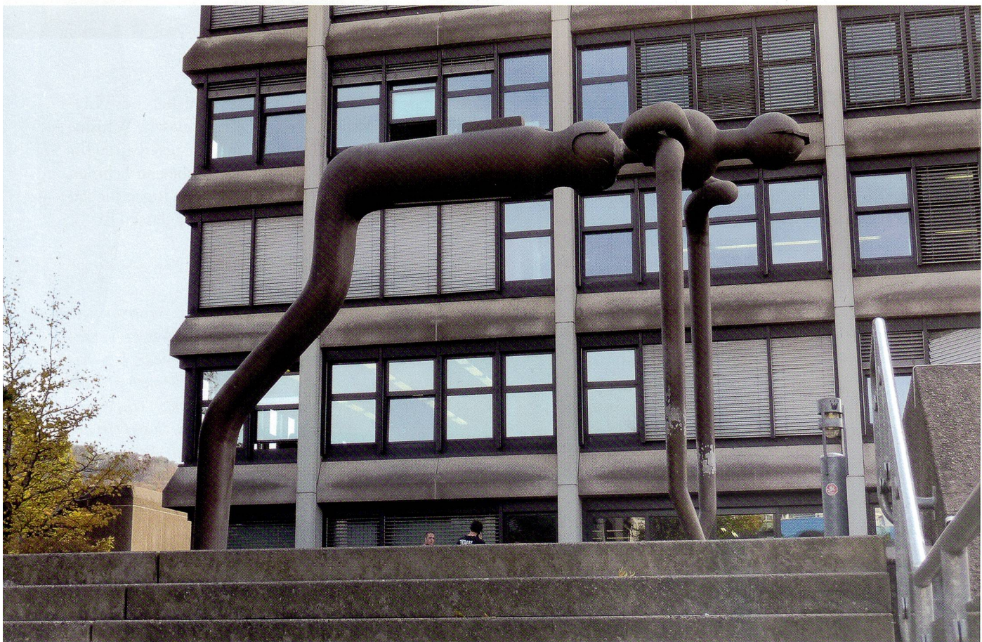
Die Figur wird eins mit dem Gebäudekomplex.

Nach Franz Eggenschwilers eigenen Angaben, ein Briefzitat, hat das Projekt «seinen Namen von einem Volkspropheten, der um 1830–50 in Österreich mit der medialen Schrift Mitteilungen niederschrieb, deren Inhalte ihm erst beim nachmaligen Durchlesen bekannt wurden. Neben vielen andern interessanten Nachrichten (im wörtlichen Sinn) berichtete er mit der automatischen Schrift von Verhältnissen im weiten Raum des Weltraums, der die Menschheit ja schon immer in seinen Bann zog, von der Beschaffenheit und den Bewohnern des Mondes. Er beschreibt den Mondaffen, der Sprünge von dreissig Metern zu machen verstehe und mit dem einen Bein abstösst.» Eggenschwiler hat diese Plastik als «Rästelplastik stellvertretend für alle Erkenntnisse, die dem