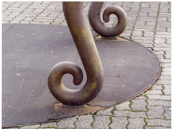
Die eingerollten Vorderfüsse

«Neben meiner konstruktiven Phase habe ich unentwegt als Spurenleser Abfälle der menschlichen Zivilisation und Kultur gesammelt, um sie zunächst fotografisch umzusetzen und später in Objekten zu verwerten», erklärt sich der Künstler. Dieses Interesse dem äusserlich Niedrigen und Verachteten gegenüber und das Bestreben, die geistigen Kräfte darin sichtbar werden zu lassen und im Kunstwerk zu erhöhen, kennzeichnen Eggenschwilers Achtung vor dem Leben. Mit 70 Jahren ist Franz Eggenschwiler am 12. Juli 2000 an den Folgen eines Hirnschlages in Bern gestorben.