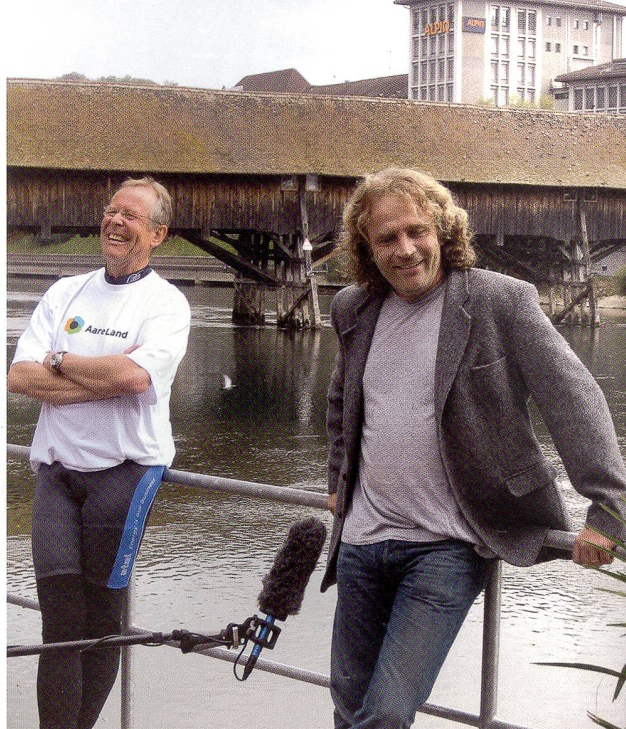
Stadtpräsident Ernst Zingg und Schriftsteller Alex Capus begrüßen den Tross bei der Eröffnungsfahrt sichtlich gut gelaunt vor der Oltner Holzbrücke im Hintergrund.

Der AareLandWeg zeigt auch ein Stück Industriegeschichte auf. Besonders eindrücklich lässt sich dies bei Schönenwerd im Bally-Areal erleben. Zu Zeiten der Bally-Dynastie war Schönenwerd eines der blühendsten Industriedörfer der Schweiz. Fabrikbauten, Arbeitersiedlungen, Fabrikantenvillen, stattliche Schulhäuser und der romantische Bally-Park zeugen davon. Während der Blütezeit der Schuhfabriken von der Mitte des 19. bis zur Mitte des 20. Jahrhunderts verzehnfachte sich die Einwohnerzahl der Gemeinde. Die Industrialisierung veränderte das