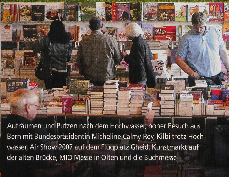
Aufräumen und Putzen nach dem Hochwasser, hoher Besuch aus Bern mit Bundespräsidentin Micheline Calmy-Rey, Kilbi trotz Hochwasser, Air Show 2007 auf dem Flugplatz Gheid, Kunstmarkt auf der alten Brücke, MIO Messe in Olten und die Buchmesse