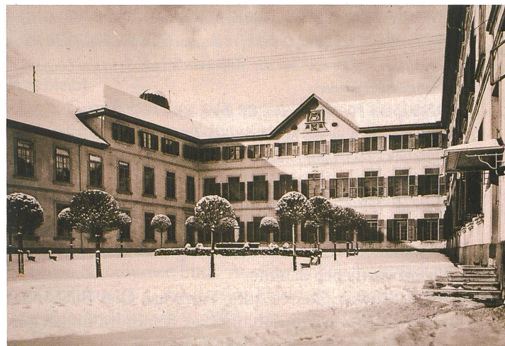
Ambassadorshof, Kantonsschule, Foto 20. Jh. 10