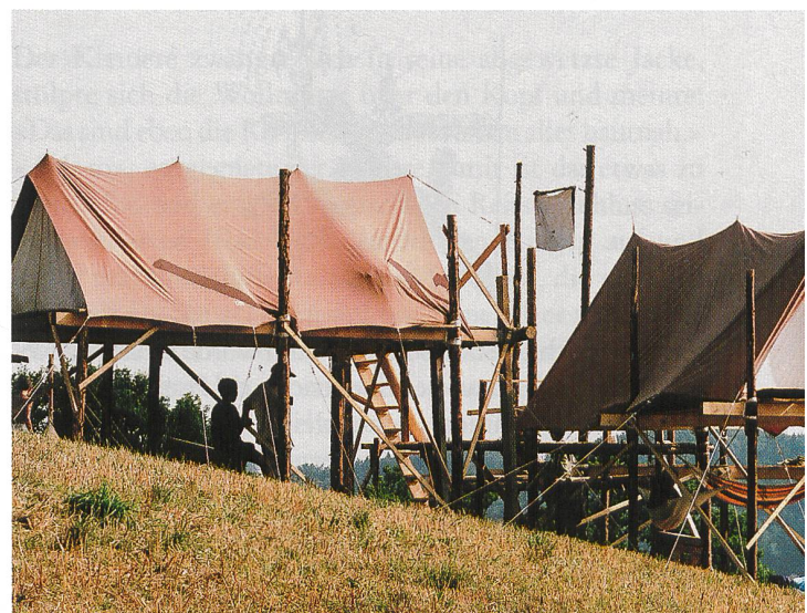
Hochzelte im Bundeslager 1994 im Napfgebiet