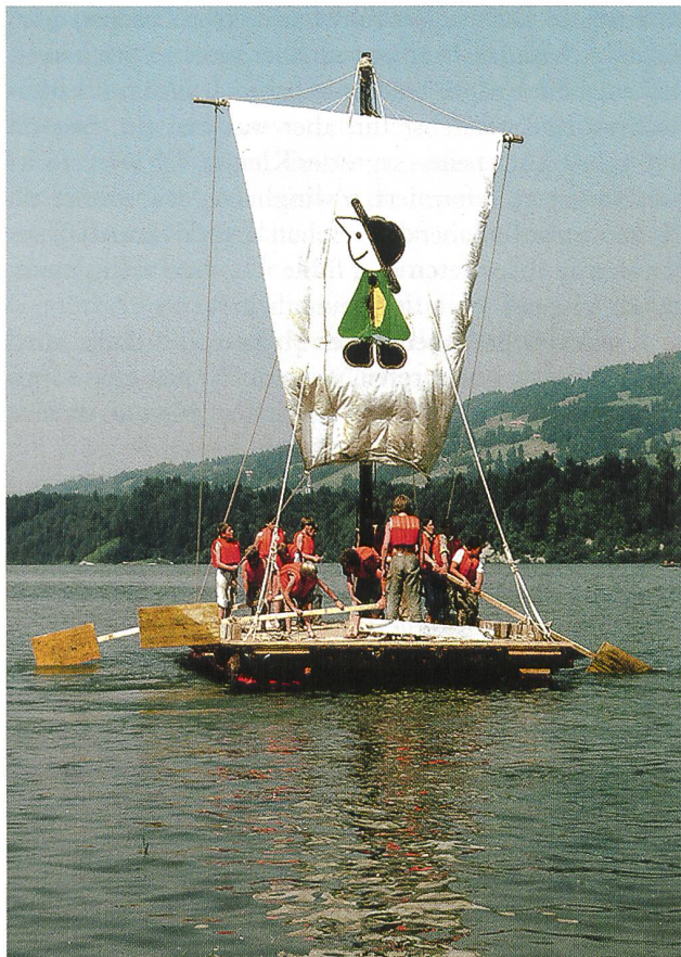
Selbst gebautes Floss auf dem Greizersee