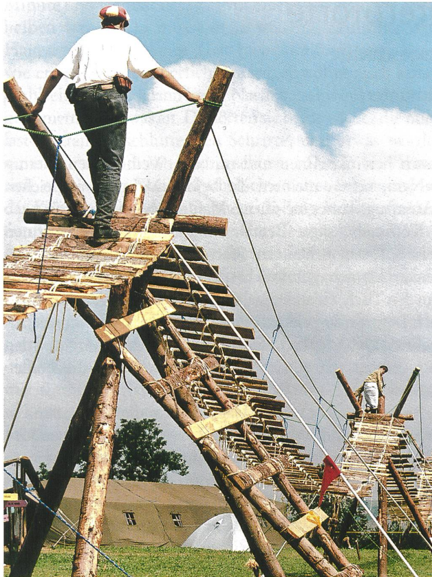
Hängebrücke Modell «Pfadi»