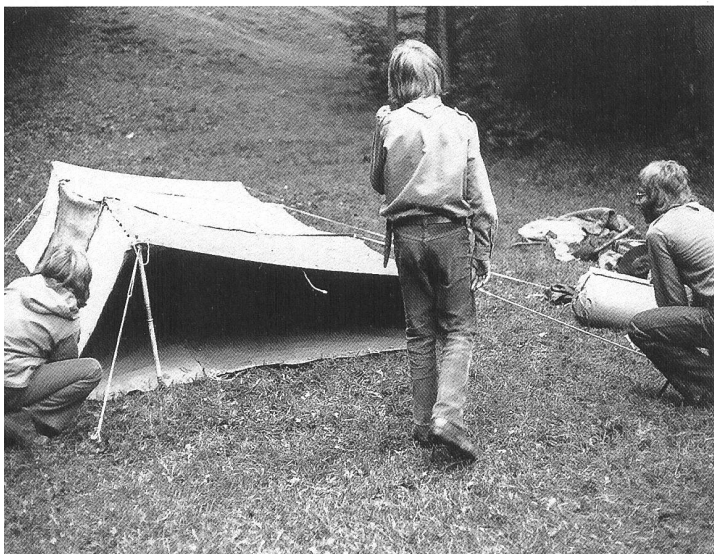
Das «Gotthardzelt» wird für eine Nacht zum Schlafzimmer des Fähnli (Pfadigruppe).