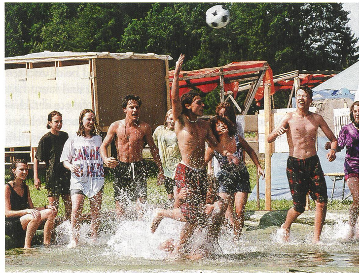
Spiel, Sport und Plausch gehören zu jedem Lager.