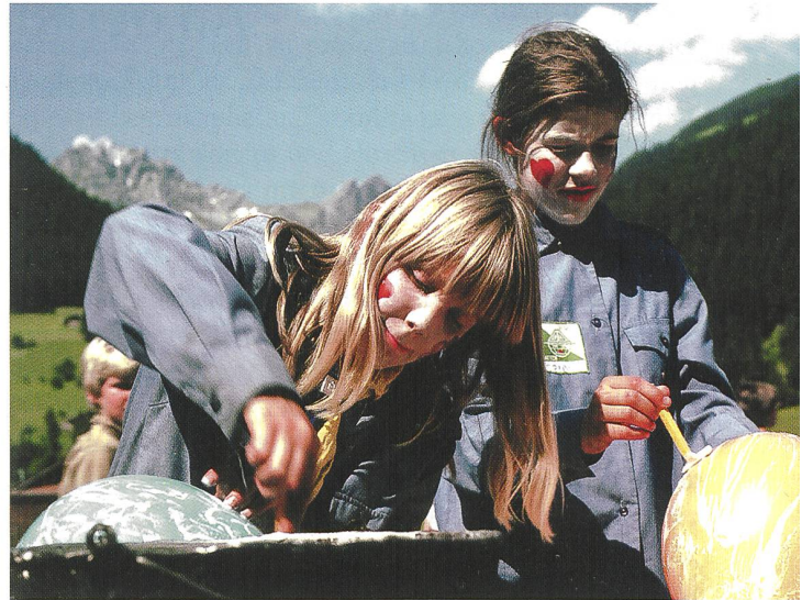
Sorgfalt und Kreativität sind hier gefragt.