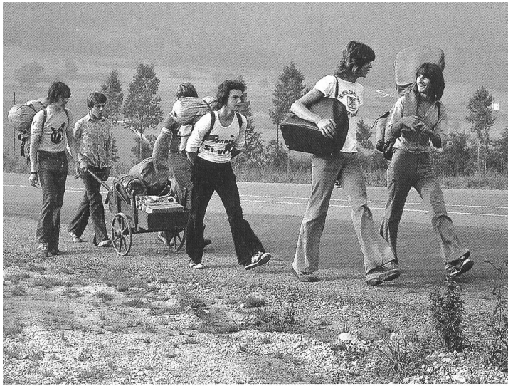
Pionniers unterwegs im Gäu 1973