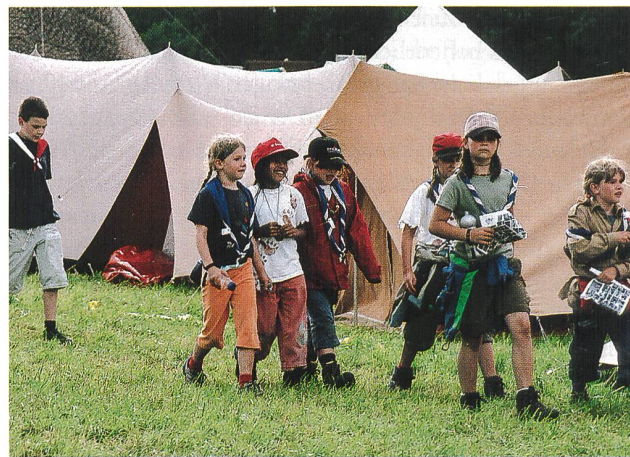
Pfadfinder und Pfadfinderinnen 2007