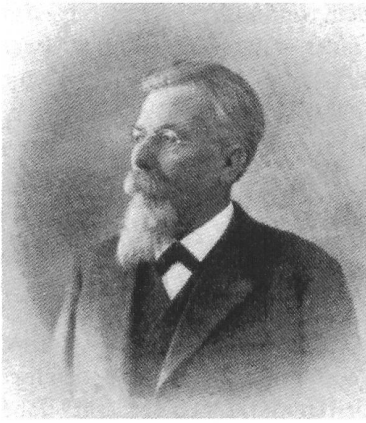
Porträtfoto von Constantin von Arx

Ständerat Franz Trog vertrat die Nein-Parole 36 . Dementsprechend wurde das Fabrikgesetz im unteren Kantonsteil deutlich angenommen, in Olten und Starkkirch mit einer Mehrheit von fast 80%, während es in der Industrieregion Leberberg nur eine relativ knappe Mehrheit fand und im Solothurn und im Wasseramt verworfen wurde. 37