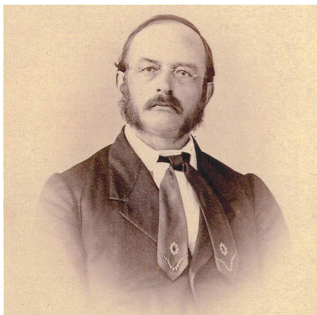
Aufgeschlossene Angehörige der Oltner Führungsschicht wie z. B. der Gerichtspräsident und Nationalrat Benedikt von Arx setzten sich für die Integration der Zuzüger ein.

Mit der Zeit wurden aber auch Arbeiter in den Verein aufgenommen, und schon bald gab es erste Anzeichen von Spannungen. An der Versammlung im Frühjahr 1864 setzte es für einige Vorstandsmitglieder Kritik ab: «Man glaubte nämlich, ein wenig mehr Energie würde dem Vorstand gut anstehen.» 19 Im Frühjahr 1872 warnte das von Benedikt von Arx mit redigierte «Oltner Wochenblatt» vor «Arbeiteranhäufungen und Arbeiteranziehungen für Fabriken». 20 An der Fahnenweihe des Grütli-vereins am 13. November 1872 waren, einem Zeitungsbericht zufolge, die Reden «von ächtem vaterländischem Geist gewürzt. Ideen, welche nach Internationalem rochen, wurden kräftig bekämpft.» 21 Dies deutet darauf hin, dass es in unserer Gegend bereits zu Beginn der 1870er-Jahre Anhänger der 1864 in London gegründeten Internationalen Arbeiter-Assoziation, der I. Internationalen, gab. Vieles spricht dafür, diese in erster Linie unter den deutschen Handwerks-gesellen zu suchen, die besonders in der aufkommenden Schuhindustrie beschäftigt waren. 22 Als im Frühling 1868 in Genf Bau-