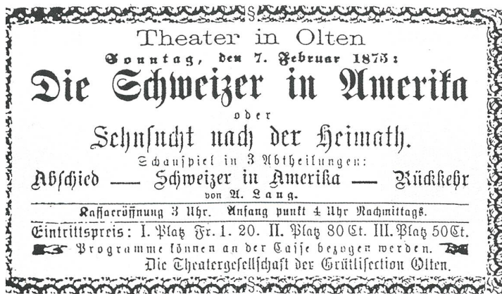
Inserat aus dem «Volksblatt vom Jura» 1875

werden. 8 Mit der Zeit aber wurden die Grütli-ler in lokale Vereinsleben integriert. Anlässlich der Fahnenweihe am 28. Mai 1862 berichtete das «Oltner Wochenblatt»: «Dieser Verein, dem man früher allerhand staatsgefährliche Absichten unterschob, konsolidiert sich mit jedem Jahr mehr. Er bildet die gesellige, politische und da, wo es die Kräfte erlauben, auch technische Fortschrittsanstalt unserer Handwerker.» Der Grütli-verein stand übrigens auch hinter der Gründung des ersten Konsumvereins im Kanton, des CVO. 9