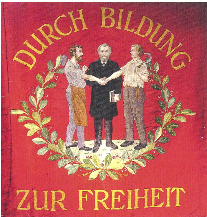
Die Fahne der Grütliktion Hägendorf 1914 (Historisches Museum Olten). Unter dem Motto «Durch Bildung zur Freiheit» reichen sich Bauer, Arbeiter und Gebildeter brüderlich die Hand – wie die drei Eidgenossen auf dem Rütli. Hammer und Sichel passten in der Schweizer Arbeiterbewegung, anders als etwa in derjenigen Russlands, allerdings nie richtig zusammen.

Der Schweizerische Grütliverein wurde 1838 von Ostschweizern in Genf gegründet und verbreitete sich nach 1848, der Gründung des Bundesstaates, im ganzen Land, unter den Emigranten sogar bis ins ferne Amerika. Der Name des Vereins bezog sich auf den Nationalmythos vom «Rütlichswur», der den aus anderen Kantonen zugezogenen Handwerkern als Modell einer «brüderlichen Vereinigung von Schweizern ohne Unterschied der Kantone» diente. Ziel des Vereins war die «demokratische Bildung» der sozial benachteiligten Schichten des Landes, die für eine aktive Mitarbeit am neuen Staat gewonnen werden sollten. Er setzte sich für eine obligatorische, staatlich geregelte Schulpflicht und für unentgeltliche Lehrmittel ebenso ein wie für eine wirksame Sozialgesetzgebung. 1851 gründete der vom französischen Frühsozialismus inspirierte Grütlianer Karl Bürkli in Zürich den ersten Konsumverein. Später entstand – auf