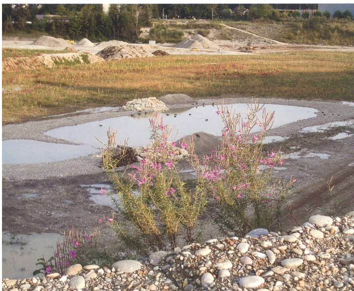
Impressionen vom Rückbau September 2006