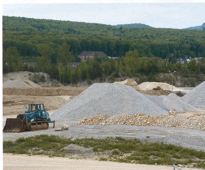
Impressionen vom Rückbau 2005