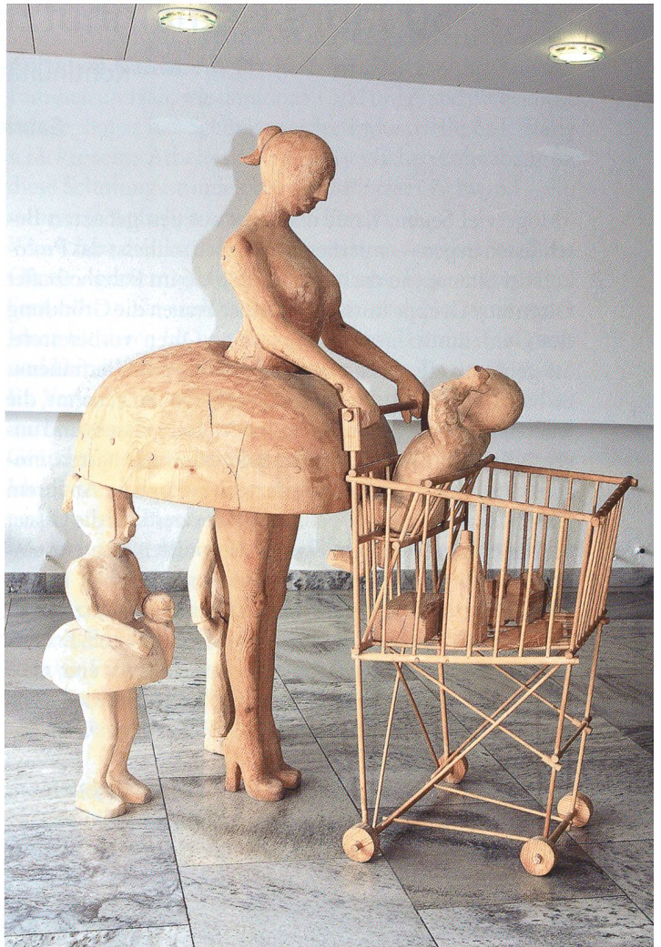
Figurengruppe aus Holz «Familie Barbie» von Wélè Bertschinger, die vor dem Weg zur Cafeteria zum Wahrzeichen der Innenräume des Spitals geworden ist, Leihgabe Kunstmuseum Olten