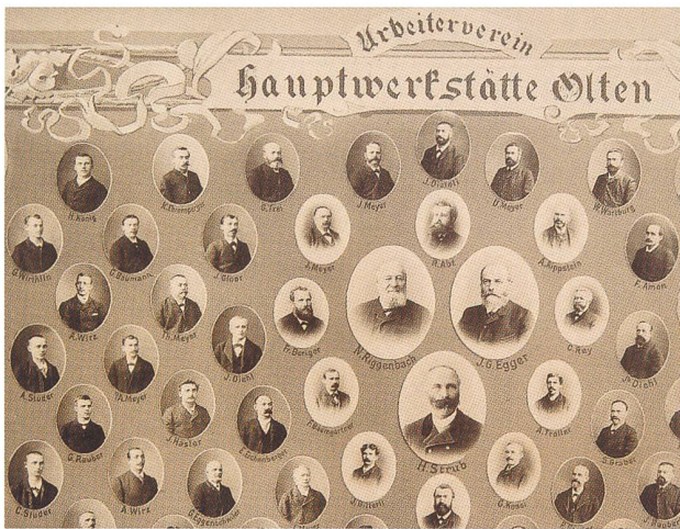
Fototafel des ersten Werkstättevereins vom Nov. 1891

Eine «Instruktionsstunde über unsere Vorschriften sowie über die Westinghousebremse» wird abgehalten. Zu den Abendunterhaltungen in den Wintermonaten mit Musik und Tanz wird jeweils auch der Führerverein VSLF eingeladen.