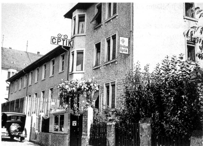
Das erste Trotter-Geschäftshaus an der Rosengasse, um 1930