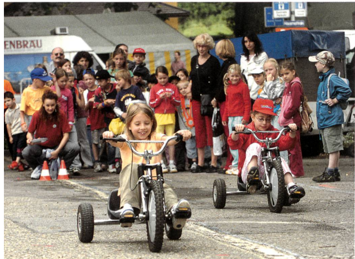
Volksolympiade am Schulfest 2005