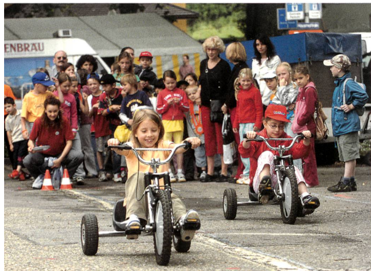
Volksolympiade am Schulfest 2005