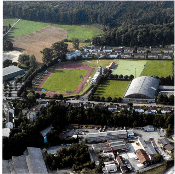
Sportanlagen im Kleinholz